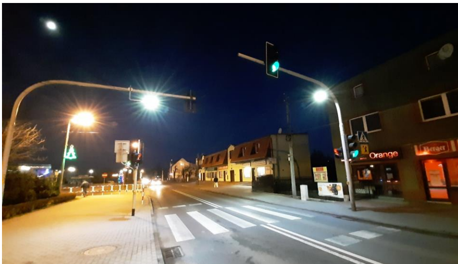
Fotografia 2. Przejście dla pieszych przy ul. Traugutta w Pszowie doposażone w elementy oświetleniowe.

Mając na względzie bezpieczeństwo pieszych użytkowników dróg powiatowych, Powiatowy Zarząd Dróg w grudniu 2019 r. zlecił doposażenie trzech przejść dla pieszych z sygnalizacją świetlną w dodatkowe elementy oświetleniowe mające zwiększyć widoczność pieszego z perspektywy kierowcy zbliżającego się do przejścia. Opisane doposażenie zrealizowano na przejściu dla pieszych wyposażonym we wzbudzaną sygnalizację świetlną przy ul. Traugutta (na wysokości dworca autobusowego), przejściu dla pieszych z sygnalizacją ostrzegawczą w rejonie Zespołu Szkół Ponadpodstawowych przy ul. Traugutta w Pszowie oraz przejściu dla pieszych z sygnalizacją ostrzegawczą w rejonie Szkoły podstawowej nr 3 przy ul. Armii Krajowej w Pszowie.