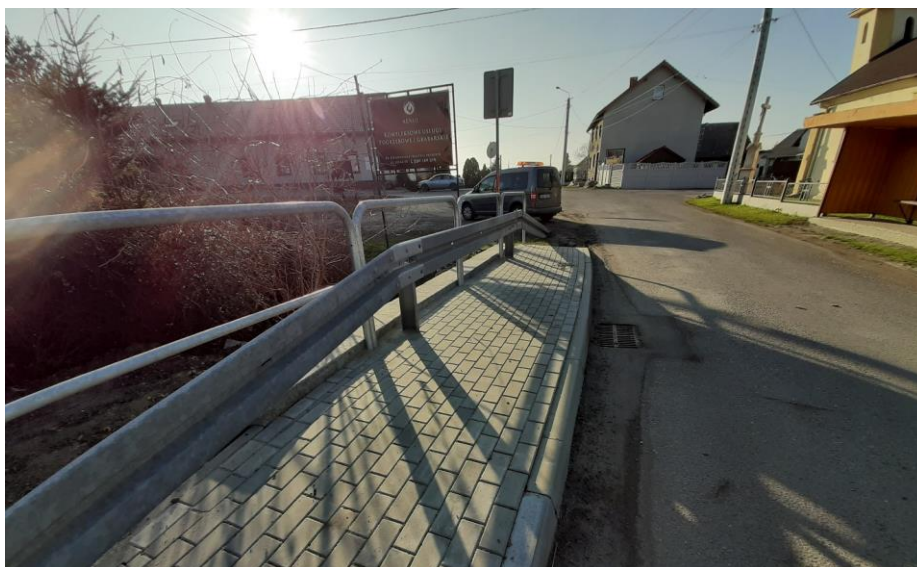
Fotografia 1. Przepust pod drogą powiatową nr 5048 S w Uchylsku.

Służba Drogowa siłami własnymi przeprowadziła remont przepustu drogowego zlokalizowanego pod drogą powiatową nr 5048 S na odcinku ul. Wiejskiej w Uchylsku. W ramach zrealizowanych prac wprowadzono w istniejący przepust o sklepieniu betonowym rurę z tworzywa sztucznego, wykonano nowy przyczółek monolityczny w miejscu istniejącego murowanego, a także wykonano fragment chodnika w obrębie przepustu.