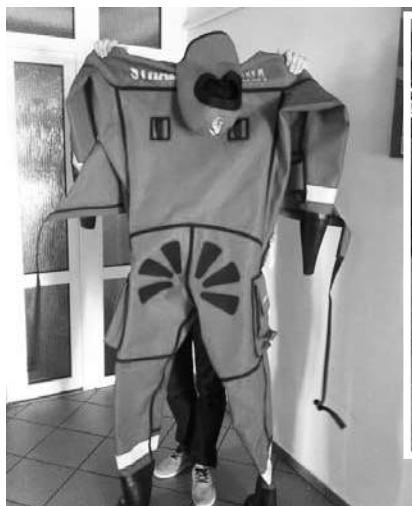
Skafander do pracy na lodzie

zasilania (np. z powodu zerwania oblodzonych kabli elektrycznych) zakupione agregaty pozwalają na wielogodzinne, a nawet kilkudniowe zasilanie awaryjne sprzętu medycznego.