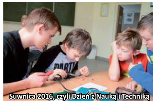
Suwnica 2016, czyli Dzień z Nauką i Techniką