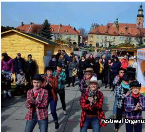
Festiwal Organizacji Pozarządowych