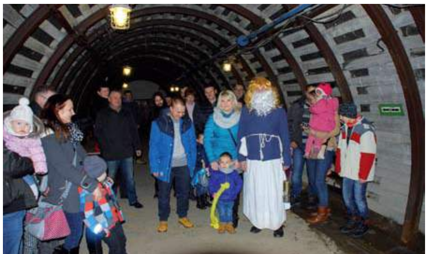
W sztolni spotkać można było Skarbka

Od lat barbórkowe zwiedzanie wodzisławskiej sztolni cieszy się nie słabnącym zainteresowaniem. W tym roku ta nie lada atrakcja, z której korzystają całe wielopokoleniowe rodziny, zainaugurowała szkolne obchody Europejskiego Tygodnia Umiejętności Zawodowych ustanowionego przez Komisję Europejską. Powiatowe Centrum Kształcenia Zawodowego i Ustawicznego w Wodzisławiu Śl. realizuje bowiem w tym roku aż pięć projektów zagranicznych, których celem jest m.in. zachęcanie młodzieży do odkrywania i rozwijania swoich pasji zawodowych.