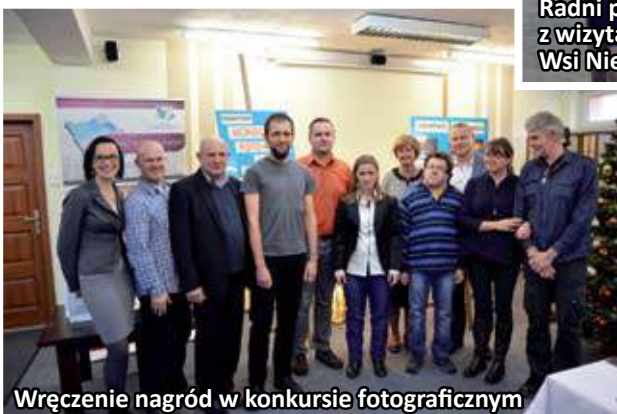
Wręczenie nagród w konkursie fotograficznym