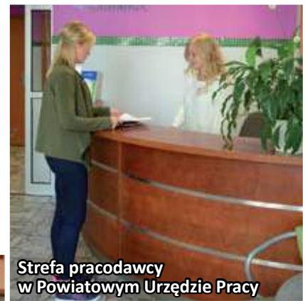
Strefa pracodawcy w Powiatowym Urzędzie Pracy