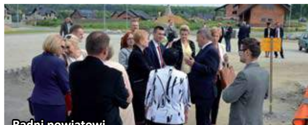
Radni powiatowi z wizytą w Nowej Wsi Nieboczowy