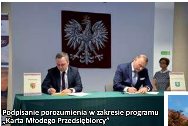
Podpisanie porozumienia w zakresie programu „Karta Młodego Przedsiębiorcy”