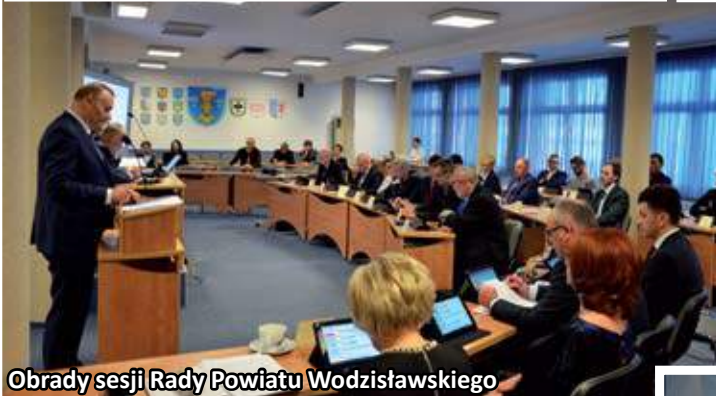
Obrady sesji Rady Powiatu Wodzisławskiego