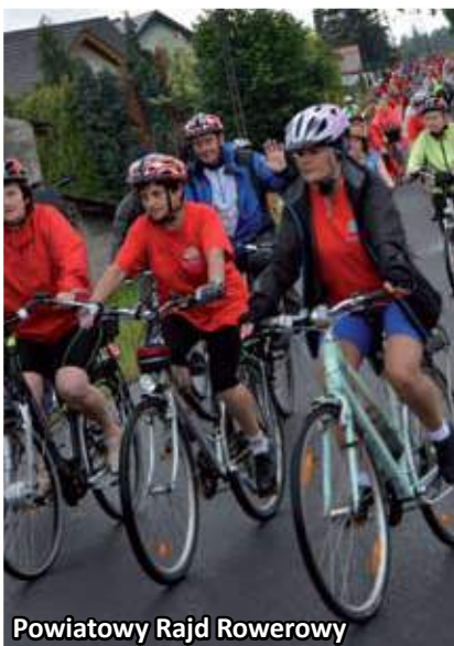
Powiatowy Rajd Rowerowy