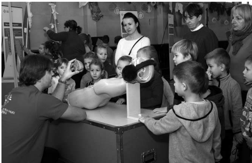
Wystawę przed dwa dni odwiedziło prawie 600 osób

Z kolei drugiego dnia w wystawie uczestniczyli uczniowie i absolwenci ZPSWR, podopieczni Warsztatów Terapii Zajęciowej, Zakładu Aktywności Zawodowej, WOŁOiZOL. Wystawa była formą prezentu mikołajkowego dla podopiecznych naszej placówki. Jak co roku Mikołajki dostarczyły mnóstwa niezapomnianych wrażeń, chociaż w tym roku w nieco zmienionej for-