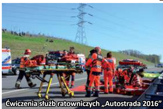
Ćwiczenia służb ratowniczych „Autostrada 2016”