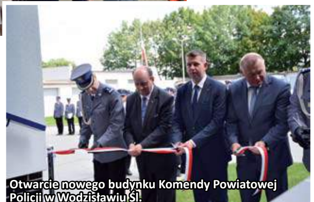
Otwarcie nowego budynku Komendy Powiatowej Policji w Wodzisławiu Śl.