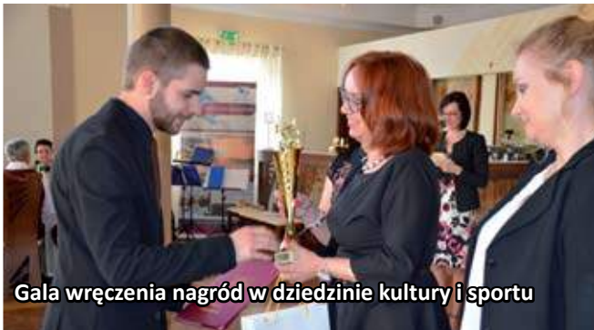
Gala wręczenia nagród w dziedzinie kultury i sportu