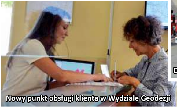
Nowy punkt obsługi klienta w Wydziale Geodezji