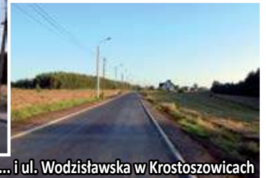
... i ul. Wodzisławska w Krostoszowicach