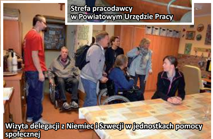
Wizyta delegacji z Niemiec i Szwecji w jednostkach pomocy społecznej