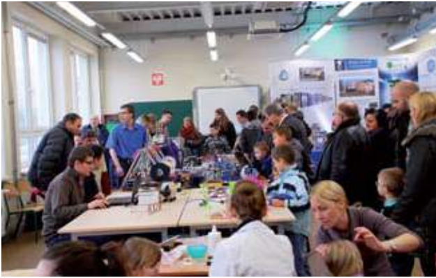
Na odwiedzających czekało wiele atrakcji, m.in. pokazy robotów oraz drukarek 3D