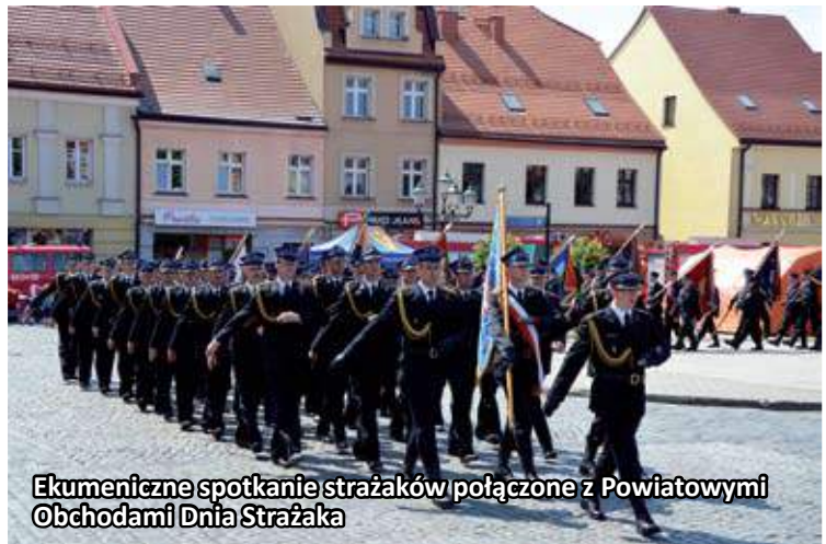
Ekumeniczne spotkanie strażaków połączone z Powiatowymi Obchodami Dnia Strażaka