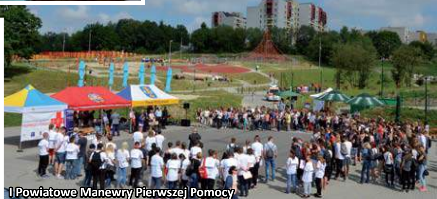
I Powiatowe Manewry Pierwszej Pomocy