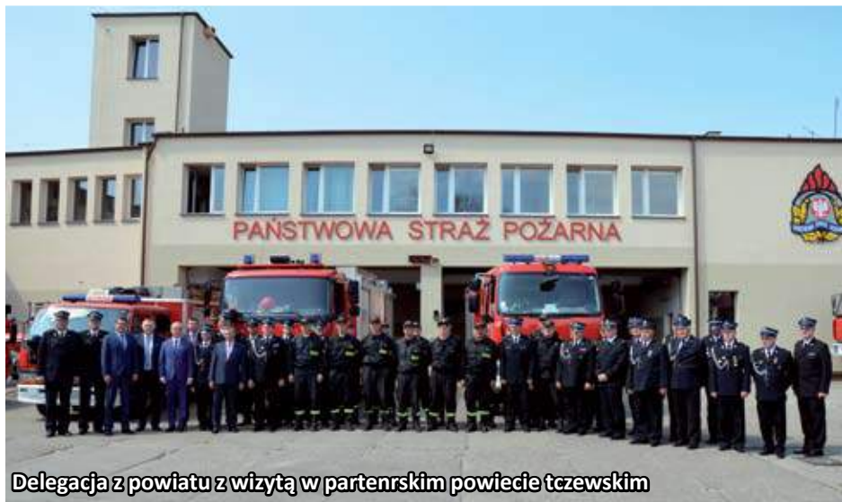
Delegacja z powiatu z wizytą w partnerskim powiecie tczewskim