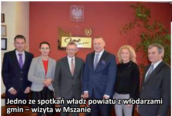
Jedno ze spotkań władz powiatu z władzami gmin – wizyta w Mszanie