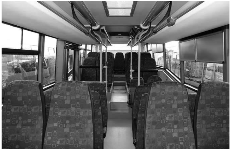
Wnętrze nowego autobusu

Korekty dotkną także linii 37 . Zmieniony zostanie jej przebieg, nie będą obsługiwane przystanki w Krostoszowicach oraz w Turzy Śl. przy ulicy Granicznej. Mieszkańcy tej ulicy uznali, że jest zbyt wąska, by kursował po niej nawet mały gabarytowo pojazd. Autobus ze Skrzyszowa pojedzie zatem przez Podbucze i Turzę Śl., gdzie zatrzyma się na przystankach w Olszownicy i na ulicy Wodzisławskiej. Tam też znajdzie się dodatkowy przystanek w pobliżu skrzyżowania z Graniczną. Taka zmiana skróci długość trasy i czas przejazdu. Zachowana zostanie jednak możliwość dojazdu uczniów z Podbucza szkolnym kursem o 7.40 (powrót o 14.25) do szkoły podstawowej i gimnazjum w Skrzyszowie. Ulegną zmianie godziny odjazdów. Autobusy z Wodzisławia Śl. kursować będą o 7.30, 11.35, 13.35, 15.05 i 16.05, a ze Skrzyszowa 7.05, 8.05, 12.15 i 15.35.