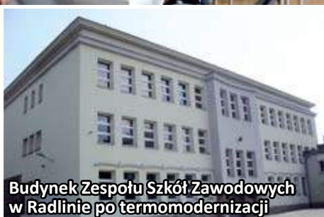
Budynek Zespołu Szkół Zawodowych w Radlinie po termomodernizacji