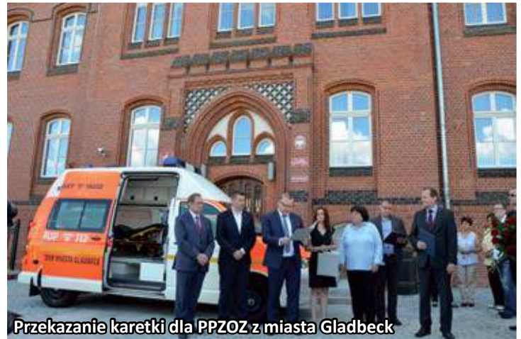
Przekazanie karetki dla PPZOZ z miasta Gładbeck