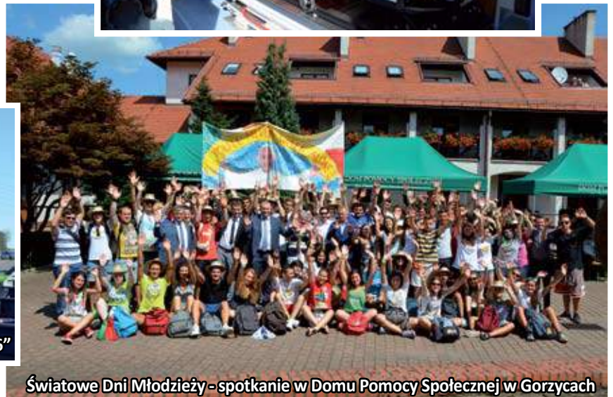
Światowe Dni Młodzieży - spotkanie w Domu Pomocy Społecznej w Gorzycach