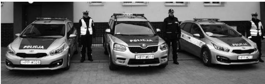
Przed siedzibą komendy policji odbyła się prezentacja radiowozów