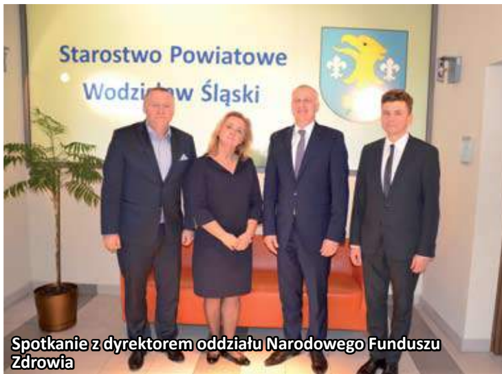
Spotkanie z dyrektorem oddziału Narodowego Funduszu Zdrowia