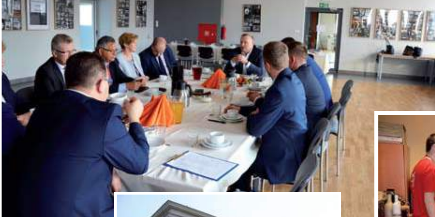
Posiedzenie Konwentu Miast i Gmin Powiatu Wodzisławskiego