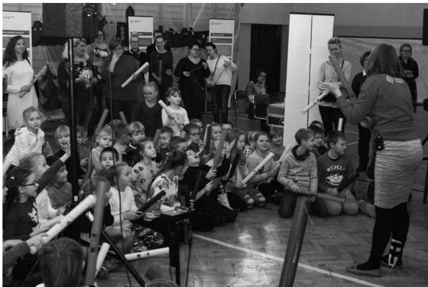
Wystawa była formą prezentu mikołajkowego

mie. Do szkoły na Kopernika przybyły Elfy – pomocnicy Mikołaja, a spotkanie z samym Świętym odbyło się poprzez łącze internetowe. Poza tym, że wszyscy uczniowie ZPSWR eksperymentowali, tworzyli gluty – własną kulkę nienewtonowską czyli ciecz, którą można uformować w kulkę, to jeszcze uczestniczyli w sesji fotograficznej. Każdy uczeń otrzyma zdjęcie klasowe