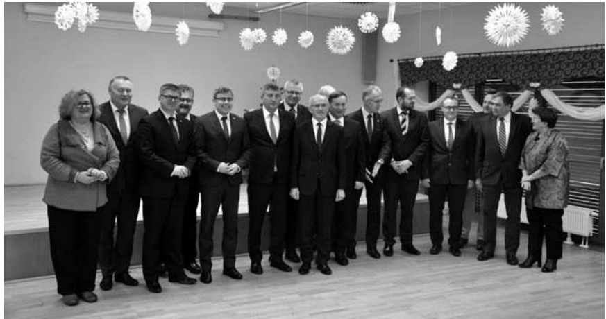
Wojewoda z samorządowcami spotkał się w gminie Lubomia