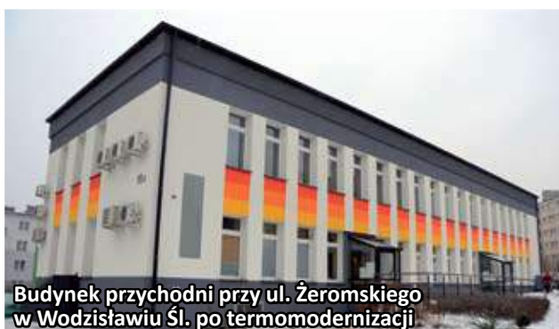
Budynek przychodni przy ul. Żeromskiego w Wodzisławiu Śl. po termomodernizacji