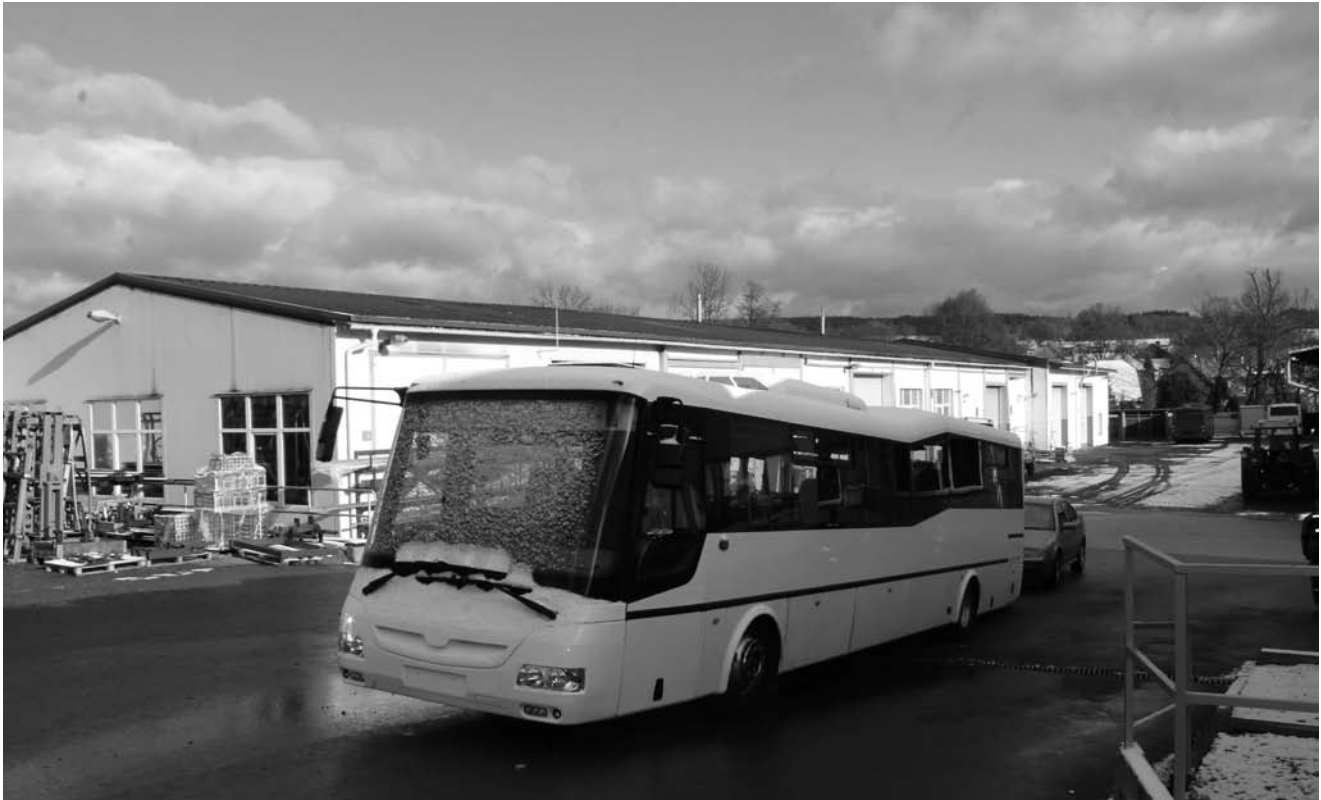
Z początkiem roku na drogi powiatu wyjadą nowe autobusy

Powiat odpowiedzialny za ponadgminną komunikację autobusową pod koniec roku podpisze nową umowę z PKS z Raciborza. Zapowiadają się także zmiany w rozkładzie jazdy. Korekty wejdą w życie 1 stycznia 2017 r. W pierwszych dniach przyszłego roku pojawią się też nowe autobusy, których produkcja właśnie dobiega końca.