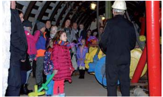
Co roku ćwiczebne wyrobisko górnicze odwiedzają całe rodziny