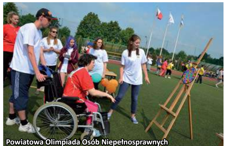
Powiatowa Olimpiada Osób Niepełnosprawnych