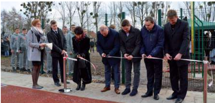
Oficjalne otwarcie nowego boiska

Podczas uroczystości starosta wodzisławski Ireneusz Serwotka opowiedział o kulisach budowy nowego obiektu, ale przede wszystkim pochwalił PCKZiU za wzorowe kształcenie młodzieży i doskonałą współpracę z przedsiębiorcami. - Placówka w której jesteśmy ma swoją historię. Przechodziła różne przekształcenia, a wszystko po to, aby dostosować się do potrzeb rynku. W tym miejscu należy podkreślić niezwykłą współpracę szkoły z otoczeniem biznesu – powiedział starosta. Nie zabrakło także wystąpień i podziękowań ze strony zaproszonych gości, wśród których byli lokalni przedsiębiorcy na co dzień współpracujący z PCKZiU. Cała uroczystość zakończona została częścią artystyczną, którą zaprezentowali uczniowie szkoły.