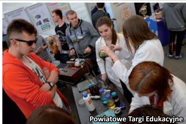
Powiatowe Targi Edukacyjne