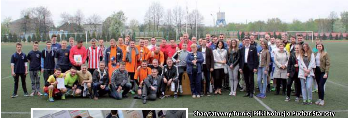
Charytatywny Turniej Piłki Nożnej o Puchar Starosty