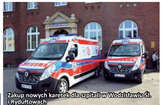
Zakup nowych karetek dla szpitali w Wodzisławiu Śl. i Rydułtowach