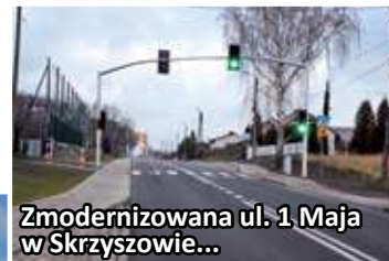
Zmodernizowana ul. 1 Maja w Skrzyszowie...