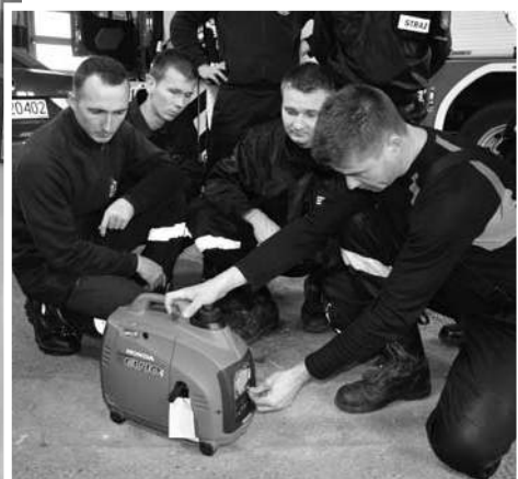
Agregat prądotwórczy do zasilania urządzeń medycznych