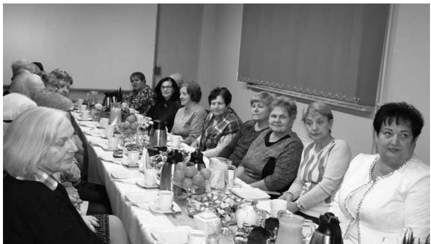
Spotkanie z byłymi pracownikami starostwa odbyło się w siedzibie urzędu

Spotkanie odbyło się w siedzibie urzędu. Było okazją nie tylko do odwiedzin murów dawnego miejsca pracy, ale również powrotu do wspomnień i wzruszających chwil związanych z czasami czynności zawodowej. Seniorzy mieli okazję zobaczyć film promujący Powiat Wodzisławski, a także dowiedzieć się co zmieniło się w urzędzie. Starosta zaprezentował im nowy schemat organizacyjny, opowiedział też o wprowadzonych zmianach w zakresie funkcjonowania niektórych wydziałów oraz o planach władz powiatu na kolejny rok. Wspomnieniom i rozmowom nie było końca. Na zakończenie spotkania każdy emeryt otrzymał drobny upominek.