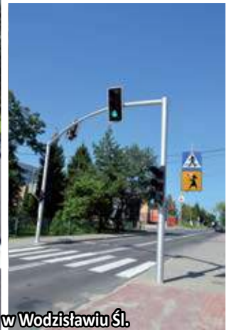
Wyremontowana ul. Radlińska w Wodzisławiu Śl.