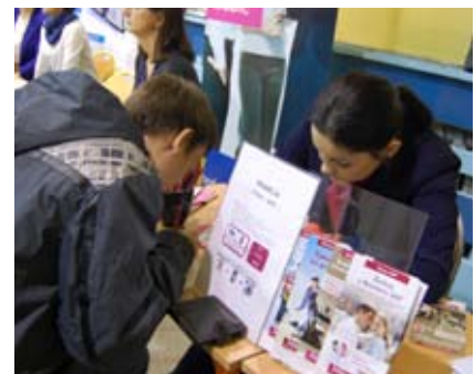
Targi pomagają młodym ludziom w znalezieniu pracy

Montaż prostych instalacji elektrycznych, programowanie robotów, wydruk 3D czy pokaz technik projektowania i automatyzacji wytwarzania to z kolei przykładowe warsztaty zaproponowane przez Powiatowe Centrum Kształcenia Zawodowego i Ustawicznego w Wodzisławiu Śląskim. Zainteresowani mogli również uczestniczyć w doświadczeniach z ciekłym azotem, dowiedzieć się, na czym polega praca analityka oraz czy zawód stolarza ma przyszłość.