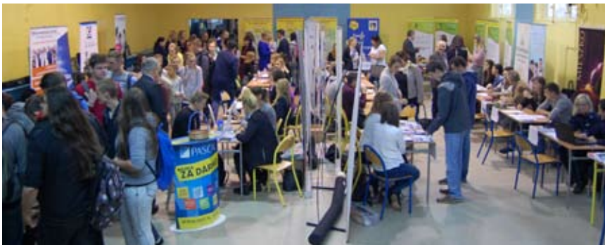
Targi przyciągnęły sporo młodzieży

W trakcie Targów odbywały się warsztaty zawodoznawcze, m.in. w zakresie fryzjerstwa, informatyki oraz mechaniki pojazdów samochodowych. Dla wielu osób było to cenne doświadczenie, które zapewne okaże się pomocne podczas planowania dalszej kariery zawodowej.