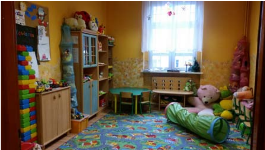
W Ośrodku funkcjonuje m.in. pokój zabaw dla dzieci

3-4 godziny przez 10 tygodni. Grupa uczestników nie może przekraczać 15 osób.