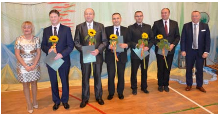
Nagrodzeni nauczyciele z władzami powiatu