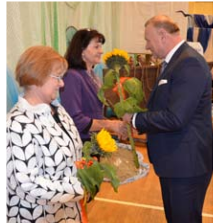
Dzień Edukacji Narodowej był okazją do złożenia gratulacji nauczycielom

Podczas uroczystości trzy nauczycielki uhonorowane zostały także medalem Komisji Edukacji Narodowej. Jest to odznaczenie nadawane za szczególne zasługi dla oświaty, w szczególności w zakresie pracy dydaktycznej,