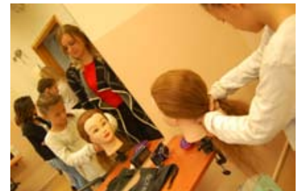
W czasie Dnia Kariery w ZSP w Pszowie można było spróbować np. fryzjerstwa