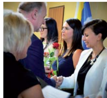
Podczas inauguracji wręczono awanse zawodowe nauczycielom