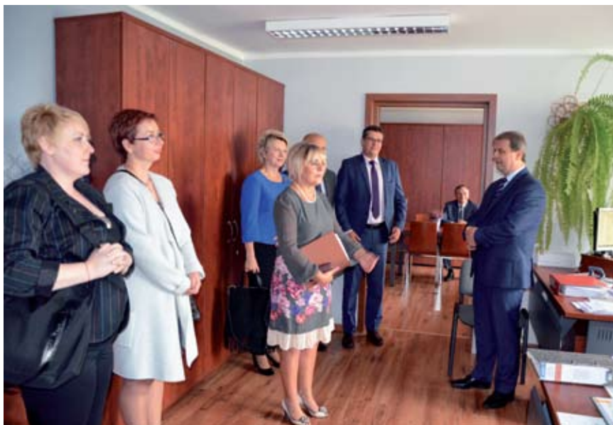
Delegacja z wizytą w naszym starostwie