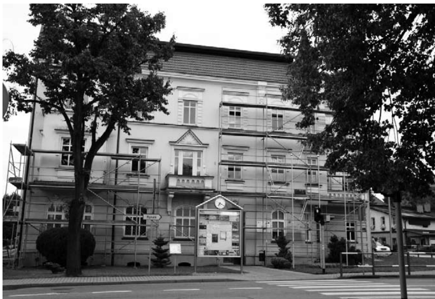
W urzędzie trwa wymiana okien

Mieszkańcy, korzystający z usług wydziałów znajdujących się w głównej siedzibie Starostwa Powiatowego przy ul. Bogumińskiej 2, mogą napotkać na utrudnienia. Trwają tam prace remontowe.