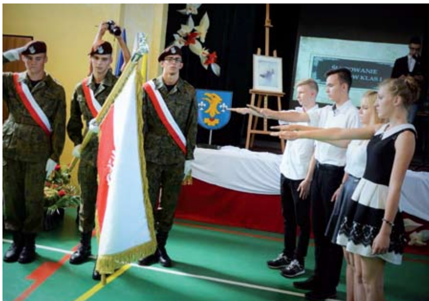
Uczniowie klas pierwszych złożyli ślubowanie

Pierwszego września rozpoczęły się nowy rok szkolny 2016/2017. W tym roku gospodarzem powiatowej inauguracji był Zespół Szkół Ponadgimnazjalnych nr 2 w Rydułtowach.