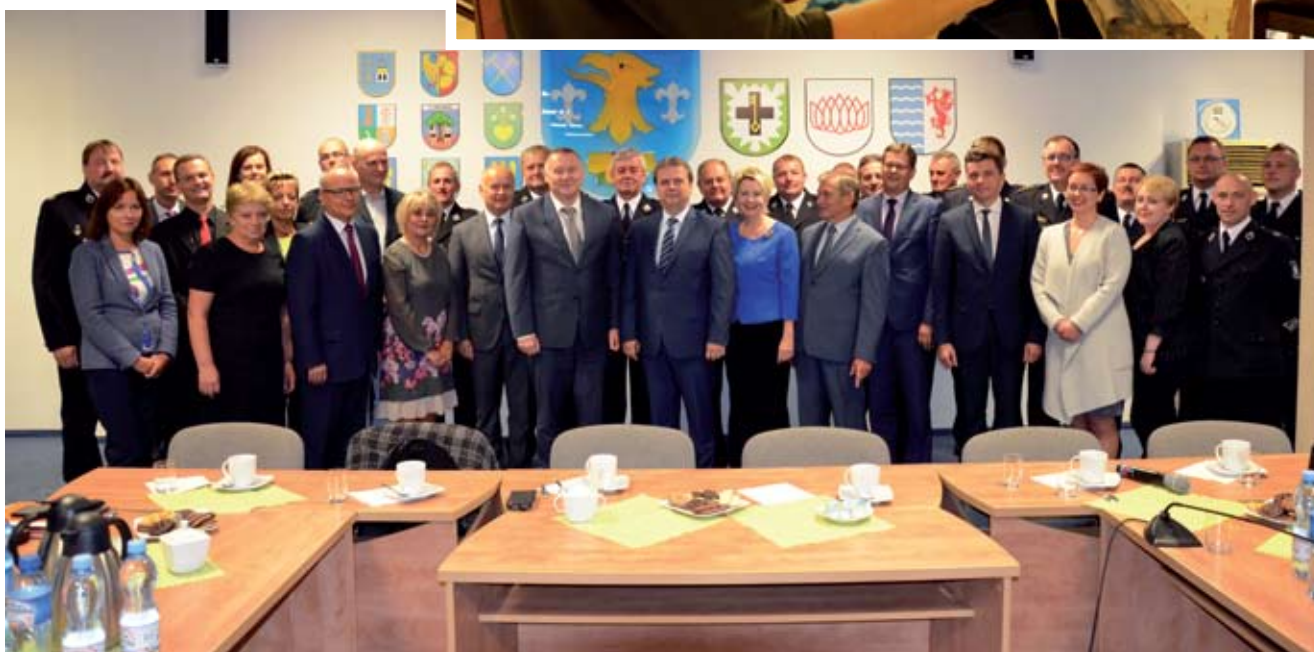
Pamiątkowa fotografia uczestników delegacji oraz gospodarzy