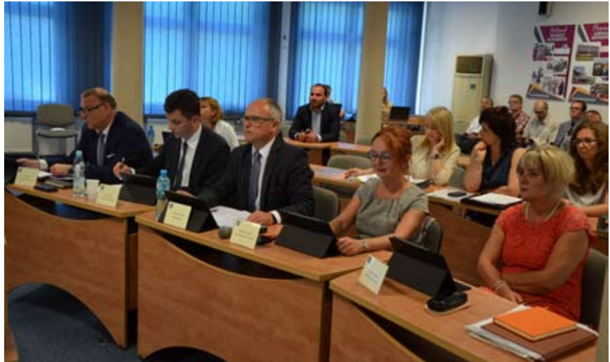
Na zdjęciu członkowie Zarządu Powiatu

Pozytywną opinię o sprawozdaniu finansowym wydała Regionalna Izba Obrachunkowa w Katowicach oraz Komisja Rewizyjna Rady Powiatu, a także niezależny biegły rewident, który ze względu na to, że powiat wodzisławski liczy więcej niż 150 tys. mieszkańców, musi badać sprawozdanie finansowe powiatu. W 2015 r. dochody powiatu wyniosły ok. 140,3 mln zł, a wydatki były o 413 602,78 zł wyższe. Wartość środków unijnych i EFTA wykorzystanych w 2015 r. przez powiat wyniosła ok. 3,8 mln zł, zaś wartość zobowiązań z tytułu kredytów i pożyczek wg stanu na koniec zeszłego roku osiągnęła poziom 15,4 mln zł.