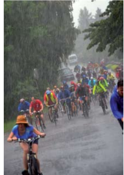
Ostatni odcinek trasy cykliści pokonywali w strugach deszczu

Po nabraniu sił na placu przed Zespołem Szkolno-Przedszkolnym nr 1 ruszyli w stronę Pszowa. Niestety tę część trasy sympatycy dwóch kótek pokonywali w strugach deszczu. Nie przeszkodziło to jednak w tym, aby wszyscy szczęśliwie i z uśmiechami na twarzach przyjechali na metę, którą zlokalizowano na terenie restauracji „Ignacowy Dwór” w Pszowie. Tam na zmokniętych, ale zadowolonych rowerzystów czekał ciepły posiłek. Podczas całej imprezy nad bezpieczeństwem uczestników czuwali strażacy z jednostki Ochotniczej Straży Pożarnej w Pszowie, członkowie Sekcji Turystyki Rowero-