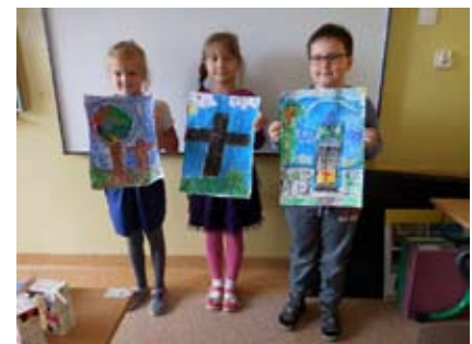
Uczniowie prezentują swoje dzieła malarskie