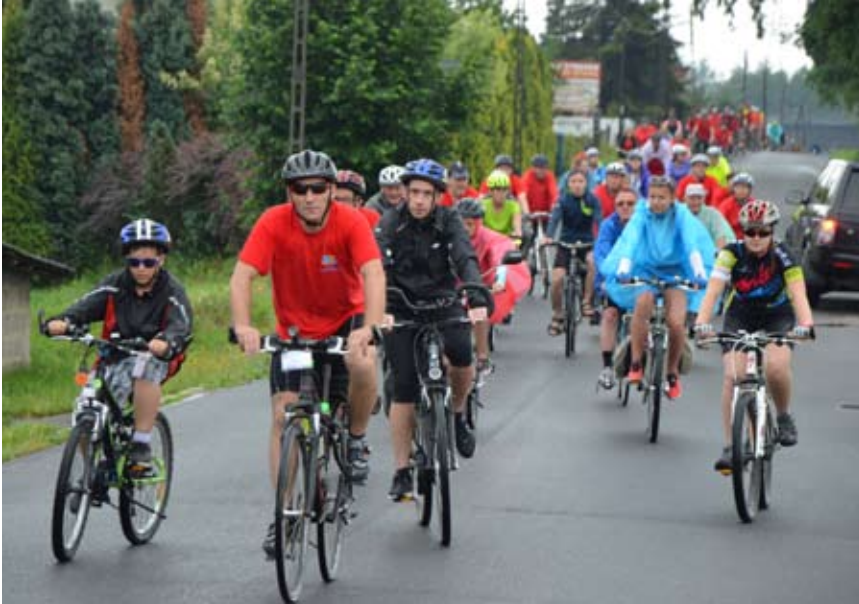
Co roku w rajdzie biorą udział całe rodziny

Kilkuset rowerzystów, pomimo niesprzyjającej aury, pokonało trasę tegorocznego Powiatowego Rajdu Rowerowego. Impreza odbyła się już po raz osiemnasty.