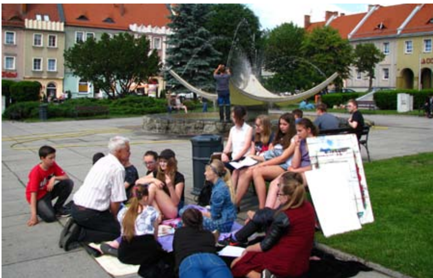
Plener malarski miał miejsce m.in. na Rynku w Wodzisławiu Śl.

Podczas warsztatów ze sztuki młodzi artyści pod okiem fachowców malowali krajobrazy powiatu wodzisławskiego. Technika była dowolna. Każdy uczeń wykonywał barwny obraz, a najlepsze dzieła zostały nagrodzone.