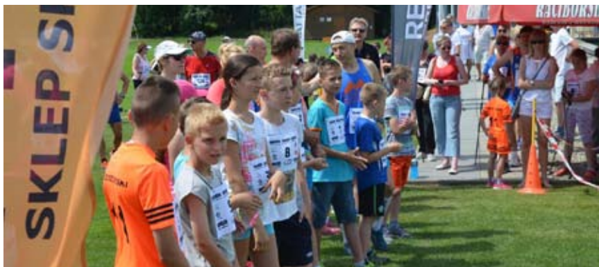
W imprezie wzięło udział również wielu młodych sportowców, którzy rywalizowali z podziałem na kategorie wiekowe