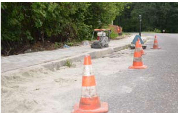
W najbliższym czasie przy drogach powiatowych powstanie 1230 m chodników, co znacznie poprawi bezpieczeństwo pieszych i kierowców

one 173 tys. zł. Drogowcy rozpoczęli już też budowę trotuaru przy ul. 3 Maja w Syryni na odcinku 320 m. Niebawem w tej miejscowości ruszą ponadto prace przy budowie ponad czterystumetrowego chodnika przy ul. Powstańców Śląskich. Nowe ciągi piesze powstaną również przy ulicy Wiejskiej w Gogołowej i Centralnej w Połomi na łącznym odcinku 240 m, a także w Radlinie przy ul. Rymera. Ten ostatni będzie mieć długość prawie ćwierć kilometra, a inwestycja obejmuje także przebudowę nawierzchni drogi na długości 400 m. W sumie wspomniane remonty pochłoną ok. 670 tys. złotych. To jednak nie wszystko. Do połowy września powstaną jeszcze nowe chodniki przy ul. Rydułtowskiej w Radlinie i ul. Bolesława Chrobrego w Wodzisławiu Śl. W ich przypadku trwają procedury przetargowe, mające na celu wyłonienie wykonawcy.