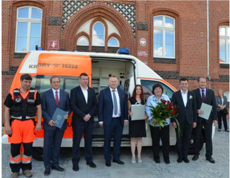
Przekazanie karetki odbyło się na placu przed Urzędem Miasta w Wodzisławiu Śl.

Samochód jest w dobrym stanie technicznym. Wyprodukowano go w 2006 roku, a jego przebieg wynosi około 135 tys. km. Ponadto karetka wyposażona jest w nosze główne, krzeselko kardiologiczne, nosze podbierakowe oraz w materac próżniowy.