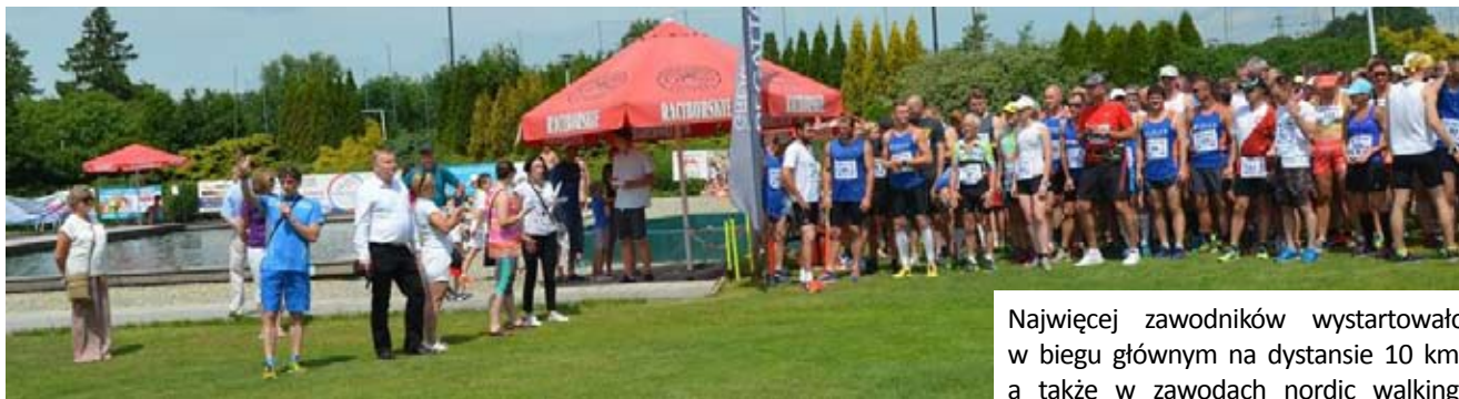
Zawody o puchar starosty przyciągnęły na tereny rekreacyjne ośrodka „Gosław” całe rodziny

Za nami trzecia edycja Festiwalu Biegowego o Puchar Starosty Wodzisławskiego, której organizatorem był Klub Sportowy „Forma”. W imprezie aktywny udział wzięło około 250 biegaczy i chodźarzy.