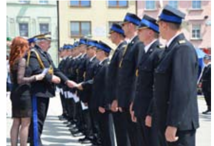
Podczas uroczystości wręczone zostały m.in. awanse na wyższe stopnie służbowe

zach świętego Floriana, którzy bronią ludzkiego życia, jednocześnie narażając swoje. Im dziś należą się szczególne podziękowania oraz wyrazy uznania – powiedział starosta, który przekazał także całej strażackiej braci najlepsze życzenia. Następnie w szyku zwartym, w towarzystwie orkiestry dętej i pocztów sztandarowych, uczestnicy przeszli do kościoła pw. Wniebowzięcia Najświętszej Maryi Panny, gdzie zostało odprawione