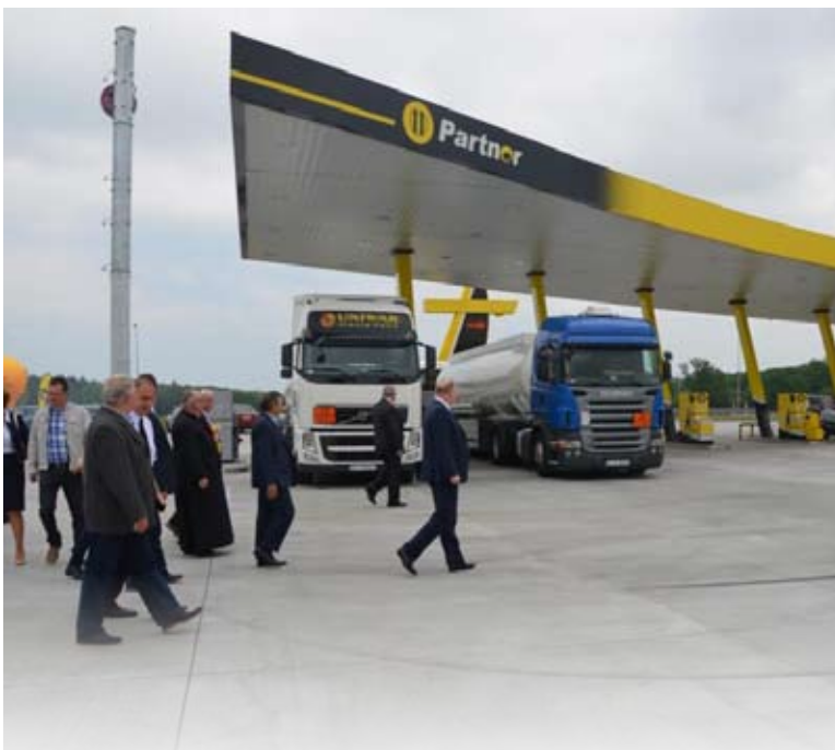
Stacja znajduje się w Łaziskach, w pobliżu węzła Gorzyce