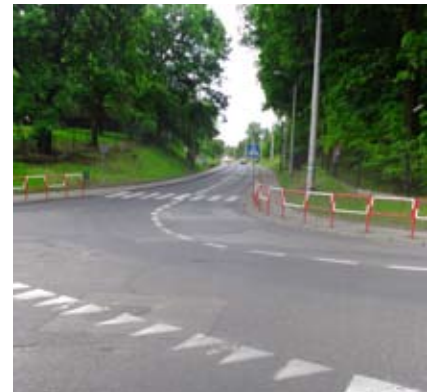
Na prawie półkilometrowym odcinku położony zostanie nowy asfalt

łożona zostanie nowa nawierzchnia i wybudowane zostaną nowe chodniki. Obecnie trwa procedura przetargowa związana z wyborem wykonawcy tego zadania. ■