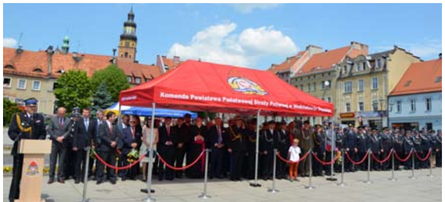
Uroczystości, które odbyły się na wodzisławskim rynku, zgromadziły wielu gości

Po części oficjalnej wszyscy obecni na uroczystościach mogli podziwiać pokazy sprzętu pożarniczego – od najstarszego do najnowocześniejszego. Była to nie lada gratka, zwłaszcza dla najmłodszych. Każdy mógł też posmakować prawdziwej strażackiej grochówki. ▀