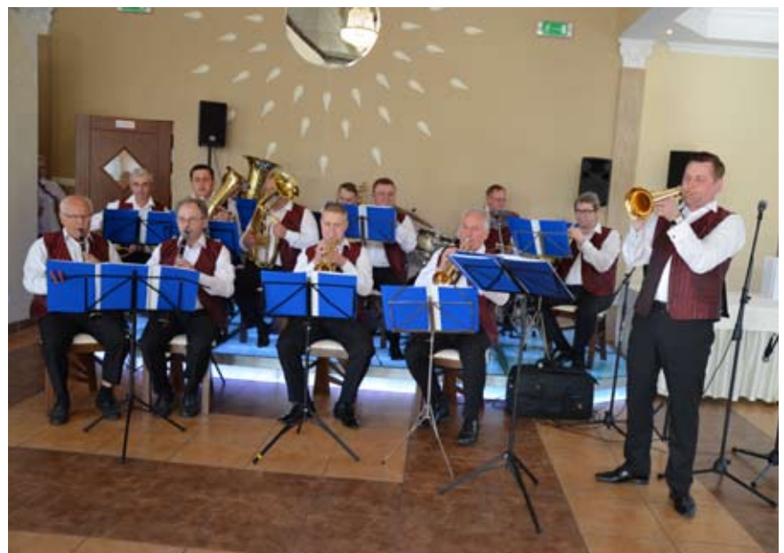
Galę uświetnił występ Fundacji Muzycznej Orkiestry KWK Anna im. W. Kamczyka