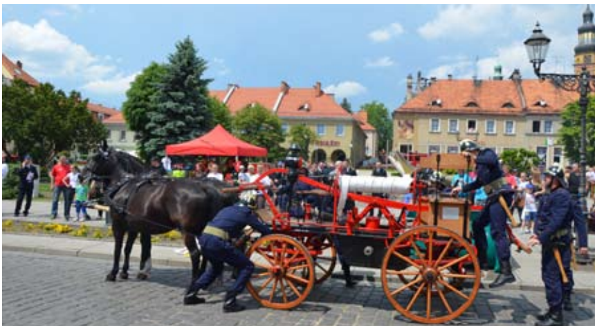
Pokaz gaszenia ognia zabytkową sikawką konną z jednostki OSP Rogów