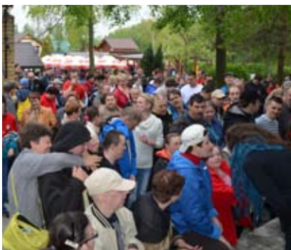
Jak co roku na koncercie bawiło się mnóstwo osób

Ogromna liczba uczestników, wspaniała zabawa i świetna atmosfera – tak można podsumować kolejny koncert „Blues dla niepełnosprawnych”, który odbył się na terenie ośrodka wypoczynkowego w Olzie.