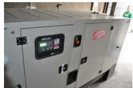
Nowy agregat zapewni ciągłość i właściwe funkcjonowanie Komendy Powiatowej Państwowej Straży Pożarnej w Wodzisławiu Śl.

trum Zarządzania Kryzysowego, Powiatowego Stanowiska Kierowania oraz Jednostki Ratowniczo Gaśniczej. Agregat włącza się automatycznie i może pracować bez tankowania 8,8 godziny. Zastąpił on starszy agregat o mocy 16 kW, który uległ awarii. ■