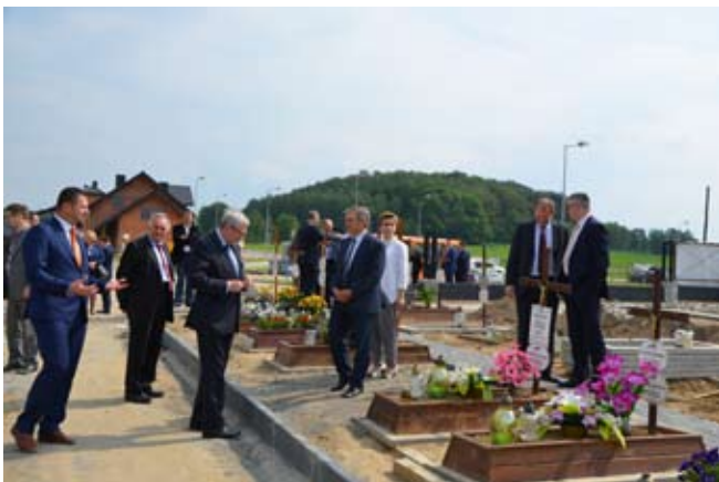
Radni zobaczyli cmentarz w nowej wsi Nieboczowy

20 maja odbyła się łączona sesja rady powiatu oraz rady gminy Lubomia. Oprócz bieżących spraw, którymi na przemian zajmowały się obie rady, jednym z punktów programu była wizyta w nowych Nieboczowach. Radni zwiedzili także obiekt Wiejskiego Domu Kultury w Grabówce.