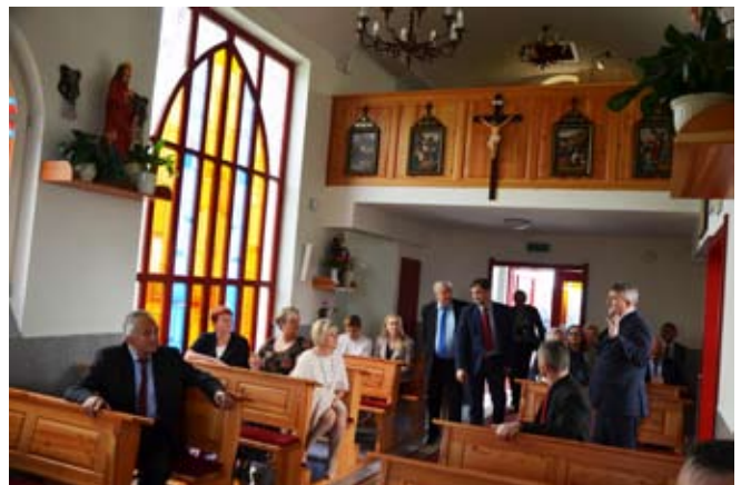
Odwiedzili też kościół i dom kultury w Grabówce