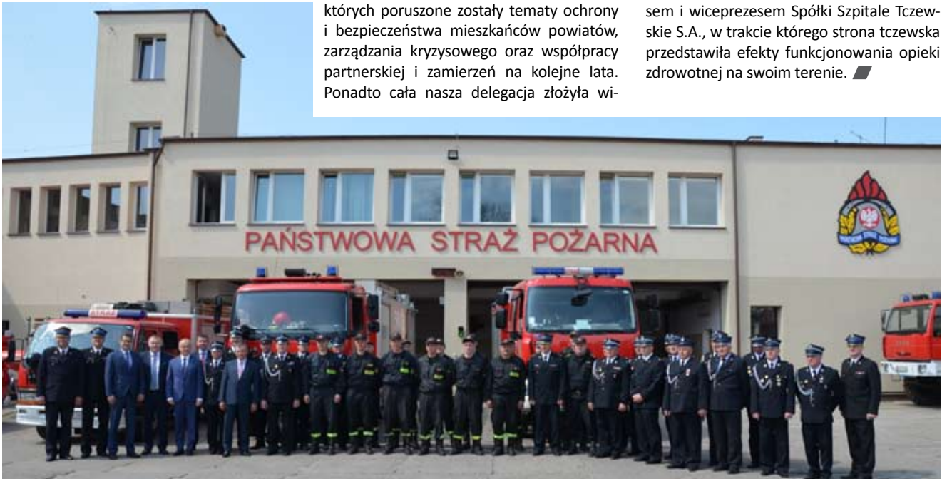
Delegacja z powiatu wodzisławskiego przed komendą w Tczewie

zytę w tczewskim starostwie, gdzie mogli zapoznać się nie tylko z warunkami pracy, lecz przede wszystkim z pracującymi tam osobami. Część spotkań partnerskich odbywała się przy udziale miejscowych władz gminnych, podczas których dzielono się też doświadczeniami w zakresie funkcjonowania samorządów. Ważną częścią wizyty było spotkanie władz naszego powiatu z prezesem i wiceprezesem Spółki Szpitale Tczewskie S.A., w trakcie którego strona tczewska przedstawiła efekty funkcjonowania opieki zdrowotnej na swoim terenie. ■