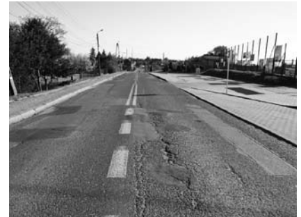
Ulica 1 Maja w Skrzyszowie doczeka się gruntownego remontu

Zadanie będzie realizowane w ramach „Programu rozwoju gminnej i powiatowej infrastruktury drogowej na lata 2016-2019”. Połowa przedsięwzięcia zostanie sfinansowana z budżetu pań-