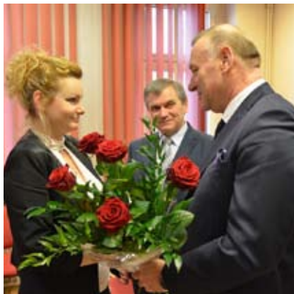
Podczas spotkania w Pszowie starosta wręczył burmistrz bukiet róż z okazji przypadającego w tym dniu święta kobiet

funkcję usługową i pomagał gminom w rozwoju. Z tego powodu poprosił, aby szefowe obu miast przedstawiły najpilniejsze sprawy do rozwiązania z udziałem powiatu lub w których powiat może je wesprzeć. Jednym z tematów była m.in. Droga Główna Południowa. Ustalono również, że już wkrótce odbędą się kolejne konsultacje poświęcone innym, ważnym tematom.