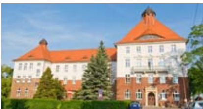
Po zmianach reorganizacyjnych oddział pediatryczny zlokalizowany będzie w szpitalu w Rydułtowach

Od 1 marca nastąpiły zmiany organizacyjne w szpitalach w Rydułtowach i w Wodzisławiu Śląskim. Dotyczą one oddziałów pediatrycznych i urazowo – ortopedycznych. Co to oznacza dla pacjentów?