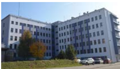
W szpitalu w Wodzisławiu Śląskim mieścić się będzie oddział chirurgii urazowo-ortopedycznej

Od 1 marca zlokalizowany został w wodzisławskim szpitalu przy ul. 26 Marca 51. Nie utrudni to jednak dostępności do świadczeń ortopedycznych. Pacjenci ze schorzeniami układu kostno-stawowego w pierwszej kolejności powinni udać się do poradni chirurgii urazowo – ortopedycznej, a tu się nic nie zmienia. W strukturach PP ZOZ działają takie dwie – przy szpitalach w Wodzisławiu Śl. i Rydułtowach. Tam lekarz decyduje o sposobie leczenia – ewentualnie o konieczności hospitalizacji – wówczas wydaje skierowanie, z którym pacjent udaje się na Izbę Przyjęć Szpitala w Wodzisławiu Śląskim.