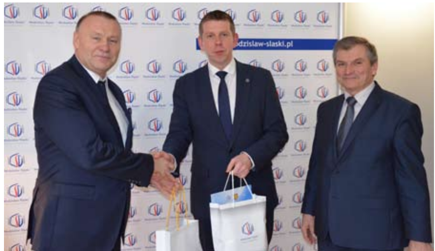
Spotkanie władz powiatu z prezydentem miasta Wodzisławia Śl.