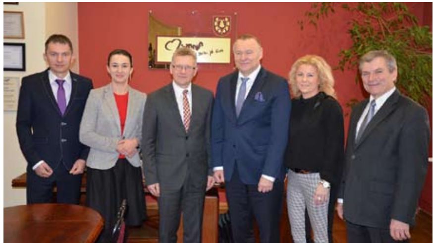
Wspólne zdjęcie w Urzędzie Gminy Mszana

W każdej miejscowości starosta podkreślał, że jego wizyty mają być świadectwem zmiany nastawienia powiatu do gmin, a także nowego otwarcia we wzajemnej współpracy, w której powiat ma w większym stopniu pełnić funkcje usługowe. Wyrazem tego był już m.in. fakt, że starosta wspólnie z przewodniczącym rady z własnej inicjatywy odwiedzali gminy, oferując pomoc i wsparcie w przewyżnianiu barier dla ich rozwoju. ■