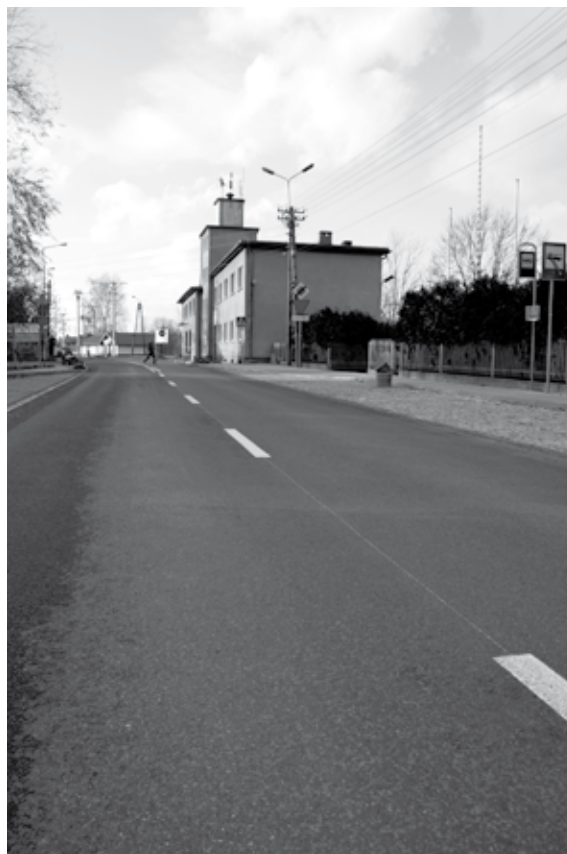
Ulica Chrobrego od ronda św. Floriana.

Programu Przebudowy Dróg Lokalnych – Etap II Bezpieczeństwo – Dostępność – Rozwój. Drugą połowę sfinansują wspólnie Powiat Wodzisławski oraz Miasto Wodzisław Śl.