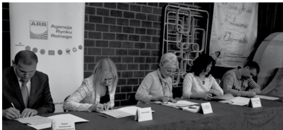
Porozumienie ze szkołą podpisały cztery lokalne firmy.

wycieczek i warsztatów u pracodawców oraz wspólną promocję i upowszechnianie tzw. dobrych praktyk. Porozumienie zawarto na czas nieokreślony.