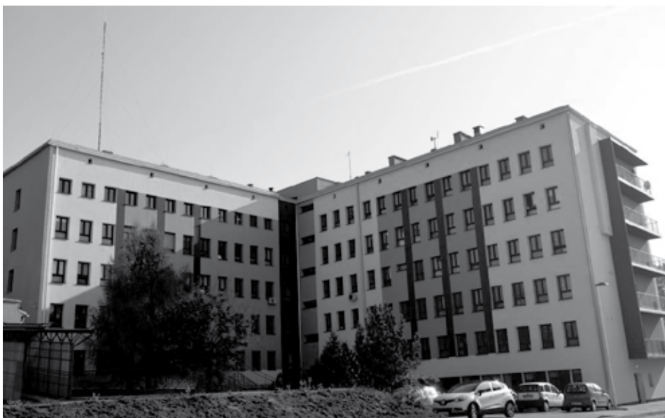
Szpital w Wodzisławiu Śląskim.

świadczeń zdrowotnych przez Narodowy Fundusz Zdrowia. Od kilku już lat wartość tzw. punktu rozliczeniowego, na podstawie którego NFZ reguluje swoje zobowiązania wobec szpitala, nie zmieniła się i wynosi 52 zł. Spadła zatem znacząco jego wartość realna, zwłaszcza że w tym czasie wzrosły ceny wielu towarów, np. niektórych leków aż o 100%. Na dodatek NFZ nie pokrywa w pełnej wysokości tzw. nadwykonań, co dodatkowo pogłębia straty szpitali.