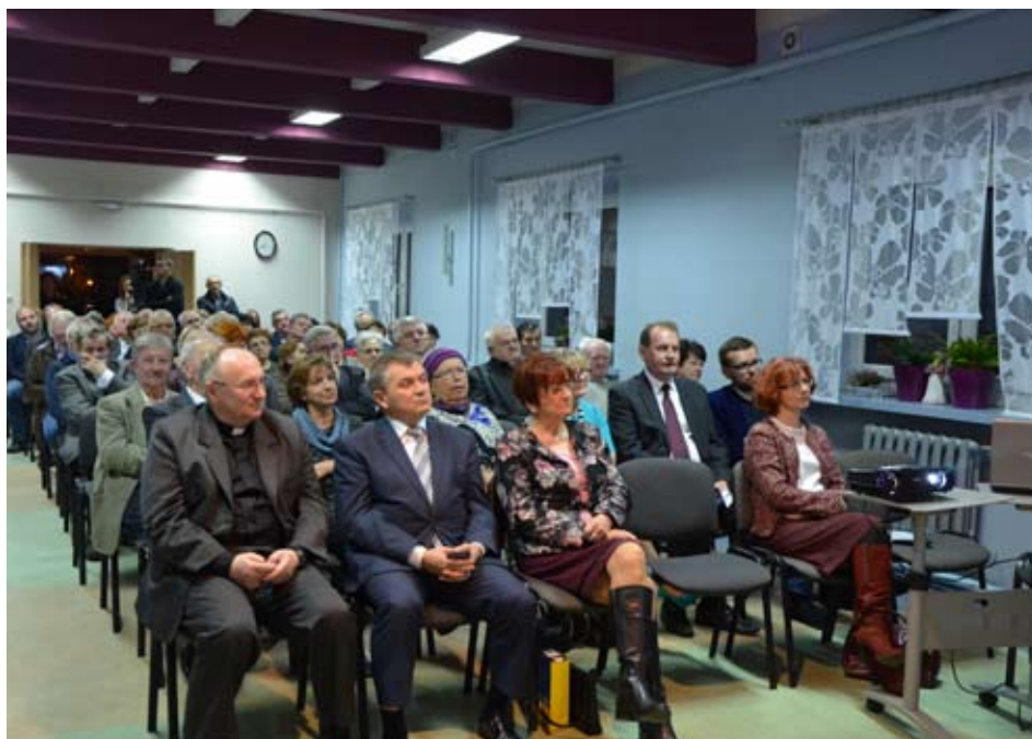
Spotkanie odbyło się w oratorium św. Józefa w Rydułtowach.

Spotkanie promujące publikację rozpoczęło od omówienia cyklu wydawniczego oraz prezentacji na temat ochrony zabytków, którą