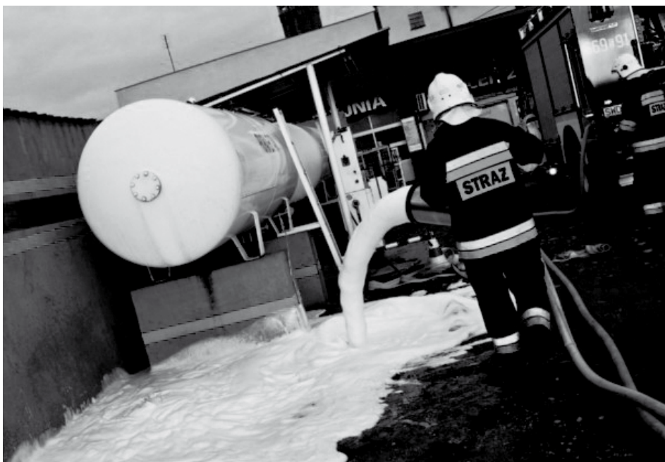
Ćwiczenia odbyły się przy stacji gazowej, by strażacy mogli poczuć się jak podczas prawdziwych działań.

W ćwiczeniach zorganizowanych dla ochotniczych straży pożarnych udział wzięło osiem jednostek (Głóźny, Radlin II, Biertułtowy, Rydułtowy, Kokoszyce, Markłowice, Turzycza, Zawada) oraz zespół ratownictwa medycznego, policja i zaprzyjaźniona z wodzisławskimi strażakami czeska jednostka SDH Havírov. Oprócz zneutralizowania zagrożenia do zadań strażaków należało m.in. wejście w aparatach powietrznych do wnętrza płonących budynków i ewakuacja