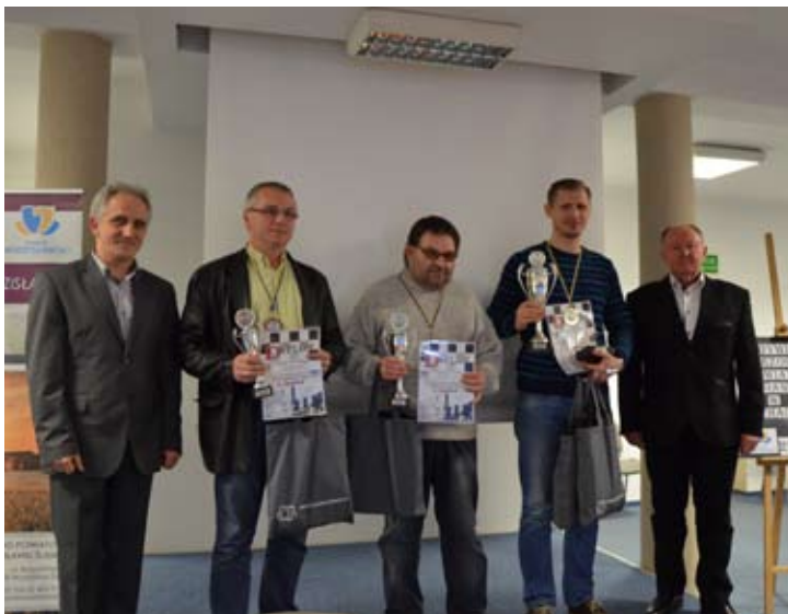
Mistrzowie szachownicy w kategorii powyżej 18 roku życia.

Do piątej edycji mistrzostw, które odbyły się przedostatnią sobotą listopada w Powiatowym Centrum Konferencyjnym w Wodzisławiu Śląskim, zgłosiło się w sumie czterdzieścioro troje zawodników reprezentujących