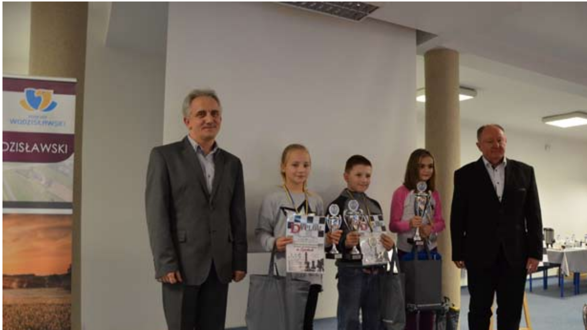
Laureaci w najmłodszej kategorii wiekowej.