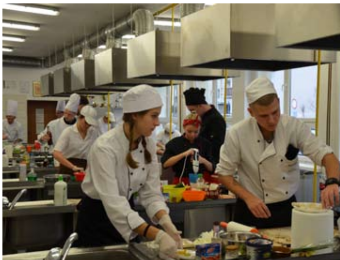
W zmaganiach kulinarnych uczestniczyło 16 drużyn.

Potrawy „na jeden kęs” królowały podczas Śląskiej Jesieni Kulinarnej, zorganizowanej po raz piąty przez Zespół Szkół Ekonomicznych w Wodzisławiu Śląskim. Mistrzami finger food okazali się reprezentanci Zespołu Szkół im. Tadeusza Kościuszki w Żarkach.