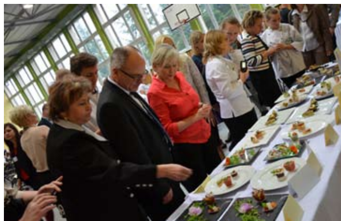
Potrawy przygotowane przez uczestników były prawdziwymi arcydziełami sztuki kulinarnej.

Poziom konkursu był bardzo wysoki. Jury, w którym zasiadali kucharze pracujący na co dzień w znanych restauracjach, pod