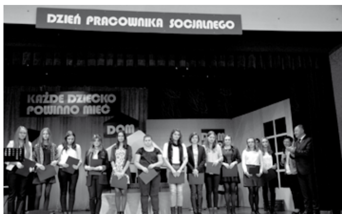
Wolontariusze z I LO w Wodzisławiu Śląskim odebrali podziękowania od starosty za posługę wolontariatu w powiatowych jednostkach pomocy społecznej.