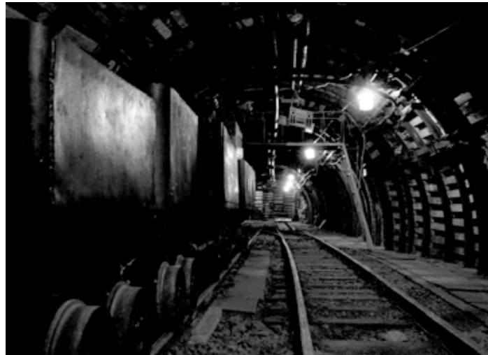
Sztolnia jest zespołem wyrobisk górniczych znajdujących się kilka metrów pod powierzchnią ziemi.

ne, w tym najprawdziwsze roboty. Ponadto słuchaczki kształcące się na kierunku kosmetyczka zapropnują masaż dłoni i/lub malowanie paznokci. Dzieci, z pomocą instruktora, będą mogły samodzielnie wykonać czako, zwierzaka z balona. Oprócz tego bezpłatne porady prawne, kosmetyczne, malowanie buziek, doczepianie kolorowych pasemek włosów, wizyta Skarbnika (w sobotę) i Mikołaja (w niedzielę). Serdecznie wszystkich zapraszamy. Wstęp wolny!