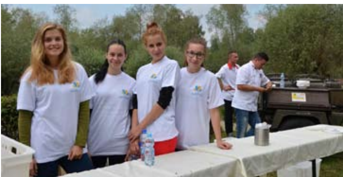
Wolontariuszki z Zespołu Szkół Ponadgimnazjalnych w Wodzisławiu Śląskim.

Dziesiąta edycja tej największej w powiecie wodzisławskim – i jednej z największych w regionie – imprezy kulturalnej dla osób niepełnosprawnych okazała się w całej jej historii rekordowa pod względem frekwencji, bowiem zgromadziła prawie 900 uczestników z 30 ośrodków z województwa śląskiego. – Organizując i wspierając tego rodzaju inicjatywy, nasz po-