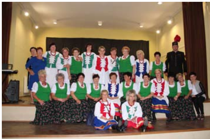
Wspólne pamiątkowe zdjęcie „Syryniczek” i „Piotrusiowych dziewczuch”.

Wzajemnie podziękowania za działania podtrzymujące i rozwijające współpracę przekazują: przewodnicząca rady gminy Morzeszczyn, starosta wodzisławski, wójt gminy Lubomia i i starosta tczewski.