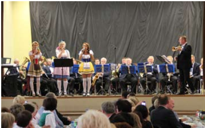
Występ Orkiestry Dętej Gminy Lubomia.

Tradycje muzyczne i taneczne Śląska i Kociewia zostały zaprezentowane w Wiejskim Domu Kultury w Syryni. Wszystko w ramach wizyty delegacji Powiatu Tczewskiego, która w połowie września gościła w naszym powiecie.