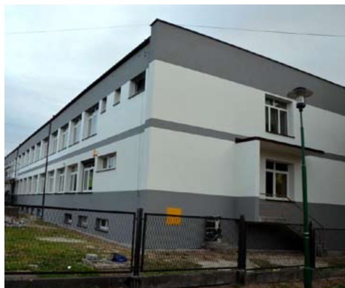
Termin zakończenia prac zaplanowano na koniec listopada.

W ramach inwestycji dotychczas nie ocieplone części budynku zostaną docieplone, a całość zostanie odmalowana. Zakres robót obejmuje również docieplenie stropodachu, wymianę stolarki okiennej w poziomie przyziemia, remont wejścia głównego oraz obejścia wokół ośrodka. Inwestycja kosztować będzie prawie 400 tys. zł. i w całości finansowana zostanie z budżetu powiatu. Remont przeprowadza firma „Toman” z Turzy Śląskiej, która wygrała ogłoszony przez Powiatowy Zakład Zarządzania Nieruchomościami przetarg. Termin zakończenia prac przewidziano na koniec listopada.