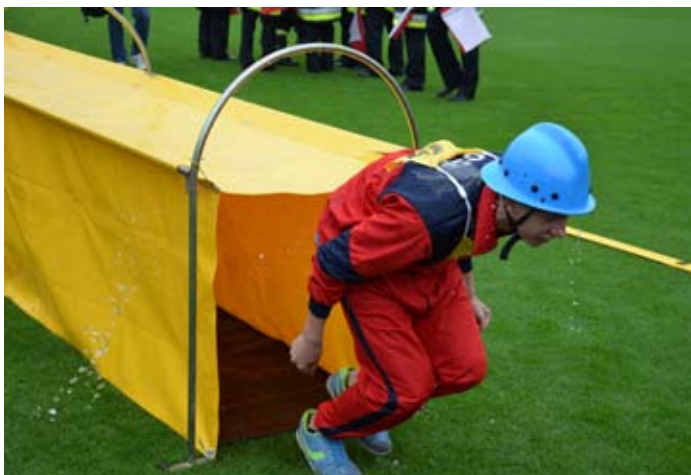
Konkurencje wymagały od uczestników wszechstronnego przygotowania.