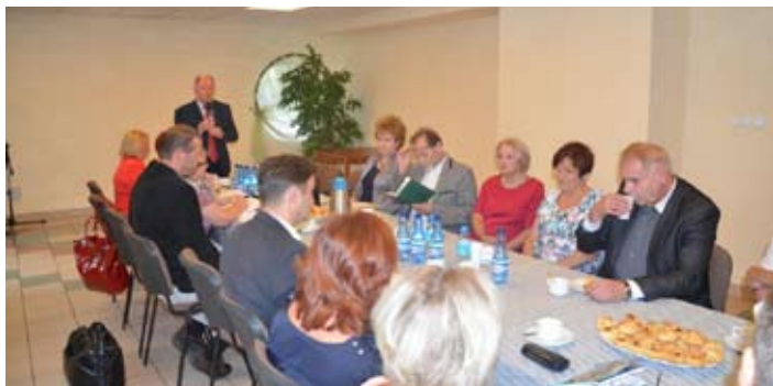
Spotkanie odbyło się w Rydułtowskim Centrum Kultury.

Przedstawiciele gmin, którym pracownicy szpitala w Rydułtowach zaproponowali utworzenie spółki, nie przyjęli oferty. Przeciwno są również związki zawodowe.