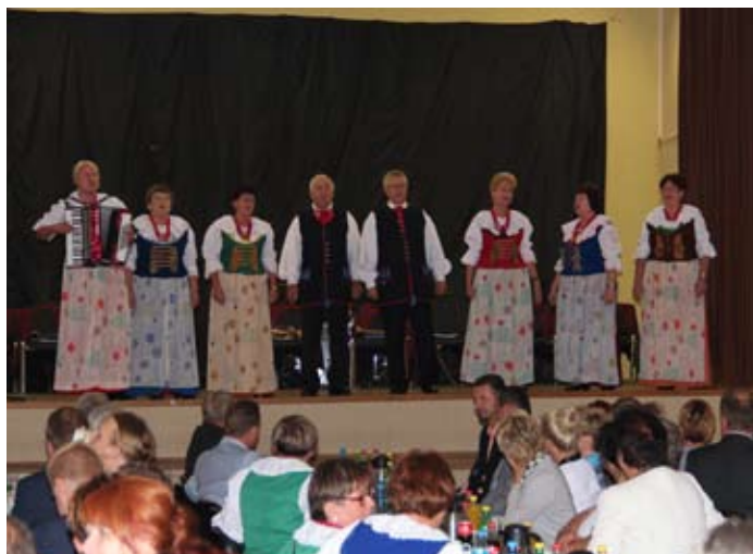
Występ zespołu Olzanki.

skie tradycje ludowe w zakresie śpiewu, muzyki i tańca zaprezentowały z kolei „Piotrusiowe dziewczuchy” - zespół działający przy ośrodku kultury w Morzeszczynie. Gospodarze przygotowali prawdziwą, regionalną ucztę dla oczu i uszu widzów. Były piękne stroje, brawurowe tańce i zabawne teksty w gwarze. Poprzez taniec i śpiew pokazali piękno i bogactwo walorów kulturowych ziemi wodzisławskiej. Podczas pobytu ponad dwudziestoosobowa delegacja z Tczewa miał również okazję uczestniczyć w jubileuszowym, X koncercie „Blues dla niepełnosprawnych”.