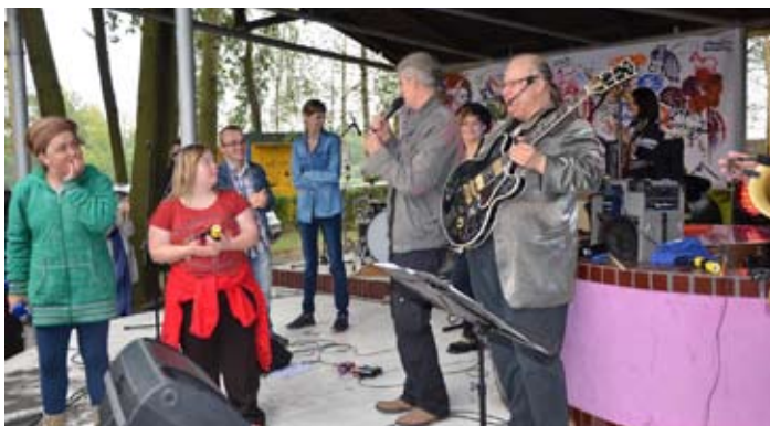
Wspólny występ uczestników i zespołu.

Rekordowa liczba uczestników, roztańczona publiczność oraz mnóstwo pozytywnej energii – tak można podsumować jubileuszowy „Blues dla niepełnosprawnych”, który odbył się w Olzie.