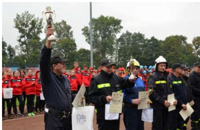
Zwycięzcy zawodów w kategorii seniorskiej mężczyzn.