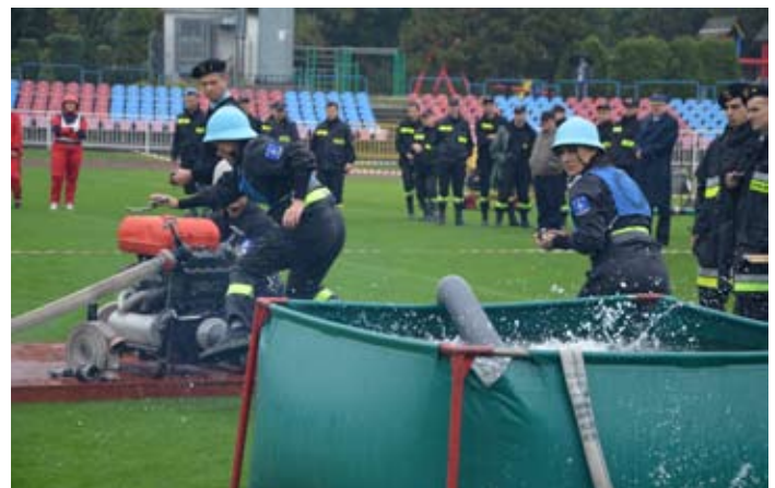
Jedna z konkurencji - ćwiczenie bojowe.