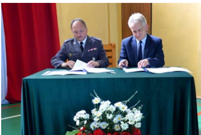
Umowę podpisali: komendant WKU w Rybniku i dyrektor szkoły w Rydułtowach.

Na współpracy z wojskiem skorzystają przede wszystkim uczniowie nowego profilu „technik logistyk ze specjalnością wojskową”, który od 1 września uruchomiono w rydułtowskiej „Dwójce”. W sumie 33 osoby będą mogły uczestniczyć w różnych zajęciach i szkoleniach prowadzonych przez zawodowych żołnierzy. - Chcemy promować wojsko i zachęcać młodych ludzi do w Wojsku Polskim. Będą spotkania z żołnierzami, weteranami, ale także wyjazdy do jednostek wojskowych oraz na obozy sprawnościowe