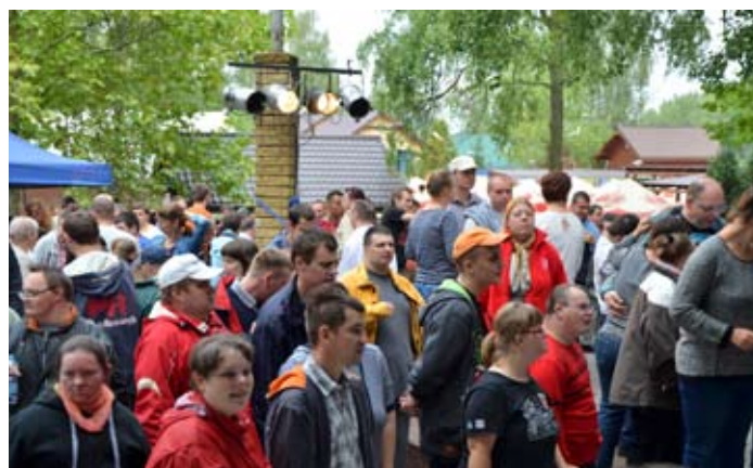
Koncert zgromadził rekordową liczbę uczestników.

wiat stawia przede wszystkim na rozwój więzi międzyludzkich i przełamywanie stereotypów, a tym samym na integrację społeczną, bo czy można znaleźć lepszą okazję do wzajemnych spotkań niż dobra zabawa i muzyka? – powiedział starosta Tadeusz Skatuła podczas otwarcia koncertu, w którym jeszcze osiem lat temu uczestniczyło ok. 200 osób.