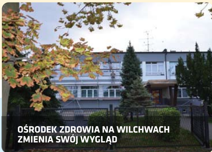
OŚRODEK ZDROWIA NA WILCHWACH ZMIENIA SWÓJ WYGLĄD