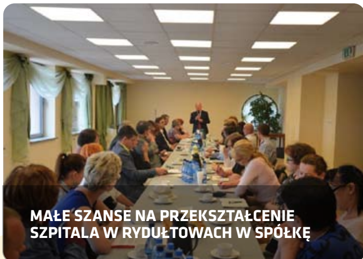
MAŁE SZANSE NA PRZEKSZTAŁCENIE SZPITALA W RYDUŁTOWACH W SPÓŁKĘ