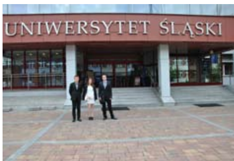
Przedstawiciele wodzisławskiej „Budowlanki”.

Po raz kolejny sukcesy uczniów szkół ponadgimnazjalnych zostały zauważone i docenione. Tym razem najzdolniejsza młodzież z powiatu wodzisławskiego wzięła udział w uroczystym „Śniadaniu Mistrzów”, które zorganizował Śląski Kurator Oświaty i władze województwa śląskiego.