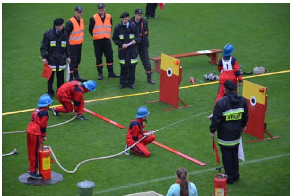
Oprócz szybkości podczas wykonywania zadań, liczyła się również precyzja.

Najwięcej zespołów, bo aż dziewięć, konkurowało w grupie mężczyzn, po pięć – wśród drużyn młodzieżowych, a trzy w grupie kobiet. Wszystkie drużyny wzięły udział w sztafecie