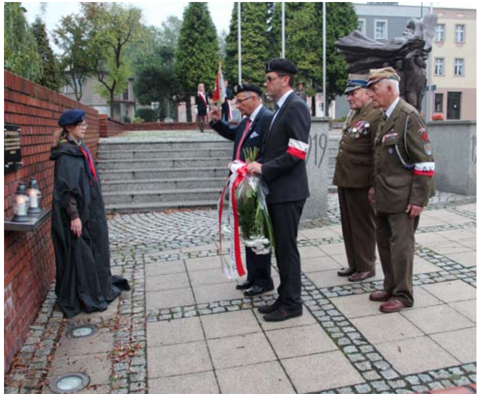
Złożenie kwiatów pod pomnikiem w Wodzisławiu Śląskim.