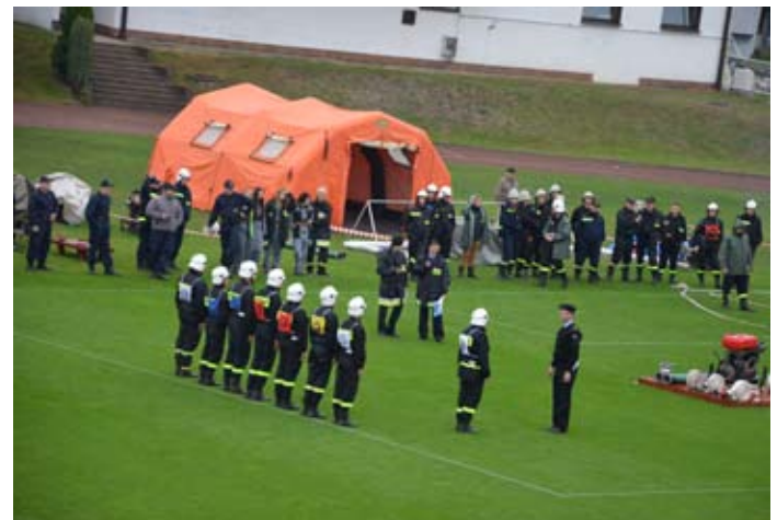
Drużyny przed rozpoczęciem ćwiczenia bojowego składały meldunek.