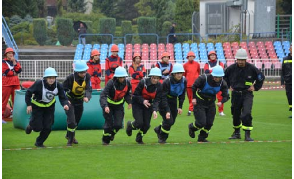
Zwyciężczynie wśród kobiet - strażaczki z OSP Skrzyszów.

długo nie chciała się uruchomić, skazując zawodników na porażkę. Wśród drużyn kobiecych na pierwszym stopniu podium stanęły reprezentantki OSP Skrzyszów . Tuż za nimi sklasyfikowane zostały strażaczki z Lubomi oraz z Zawady. Najlepszą młodzieżową drużyną pożarniczą chłopców okazała się reprezentacja OSP Lubomia , która wyprzedziła OSP Łaziska, OSP Radlin II, OSP Syrynię i OSP Czyżowice. Wśród młodych strażaczek bezkonkurencyjne okazały się dziewczyny z OSP w Łaziskach . Kolejne miejsca zajęły: OSP Gorzyczki, OSP Zawada, OSP Lubomia i OSP Turzyczka. Więcej zdjęć na Facebookowym profilu Powiatu Wodzisławskiego.