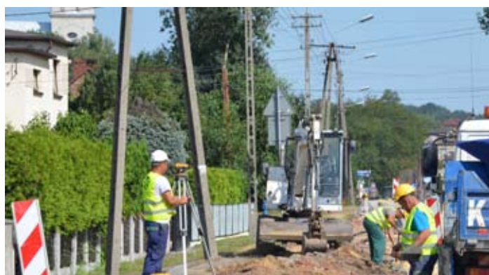
Ekipy drogowe układają krawężniki na odcinku od ronda św. Floriana.

Przypomnijmy, że w ramach inwestycji, finansowanej w połowie z budżetu państwa w ramach Narodowego Programu Przebudowy Dróg Lokalnych oraz w połowie wspólnie przez Powiat Wodzisławski i Miasto Wodzisław Śląski, powstanie nowa jezdnia na odcinku od skrzyżowania z DK78 - ul. Rybnicką do ronda św. Floriana. Zakres prac przewiduje przebudowę nawierzchni jezdni, chodników, kanalizacji deszczowej oraz zatok