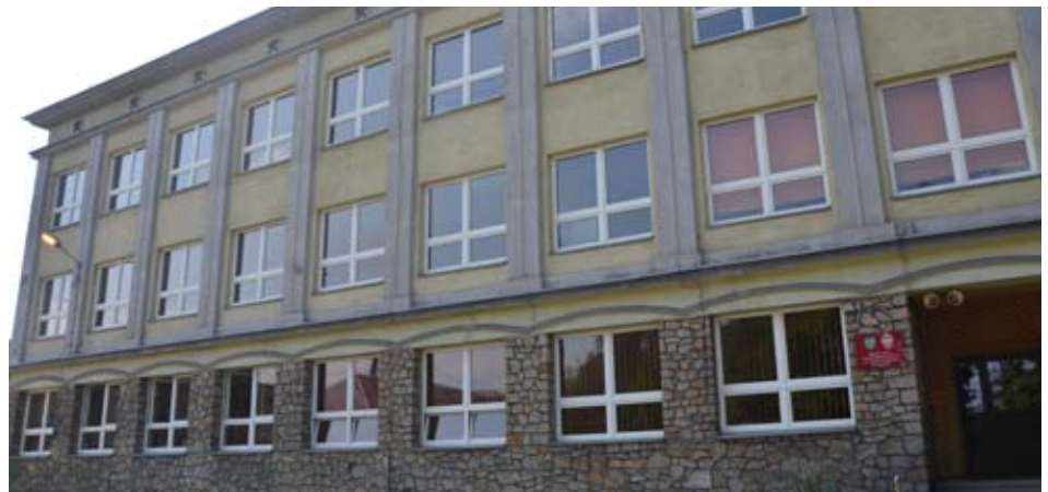
Projekt termomodernizacji budynku szkoły przewiduje odtworzenie istniejących na fasadzie budynku detali architektonicznych.

Inwestycja w szkołę w Radlinie pochłonie około miliona złotych. Większość z tych środków pochodzić będzie z budżetu powiatu wodzi-