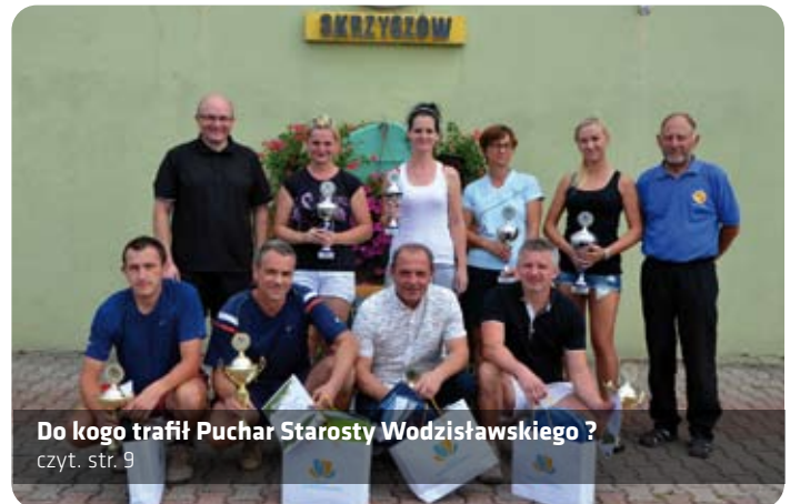
Do kogo trafił Puchar Starosty Wodzisławskiego? czyt. str. 9