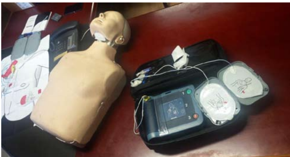
Defibrylatory wraz z zestawami szkoleniowymi.

Całość sprzętu, podobnie jak w latach poprzednich, nie trafi na magazynowe półki, ale decyzją starosty Tadeusza Skatuły będzie na co dzień wykorzystywana przez wodzisławskich strażaków. To jednak nie ostatnie zakupy sprzę-