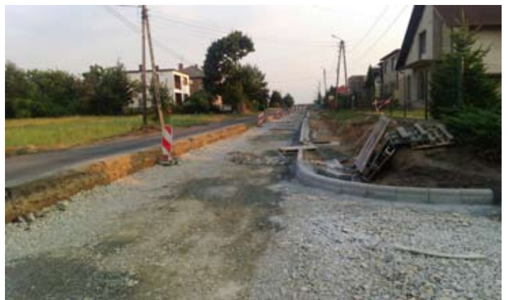
Ulica 1 Maja zyska nie tylko nową nawierzchnię, ale także wykonywana jest podbudowa drogi.

hadłowy sterowany sygnalizacją świetlną. W sumie w przeciągu ostatnich dwóch lat powiat wspólnie z gminą na remonty dróg powiatowych na terenie Godowa i okolic wydał prawie 2 mln zł.