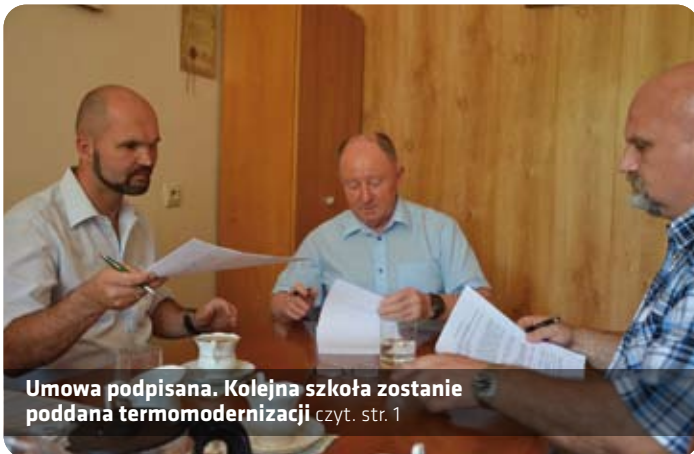
Umowa podpisana. Kolejna szkoła zostanie poddana termomodernizacji czyt. str. 1

BEZPŁATNE CZASOPISMO STAROSTWA POWIATOWEGO