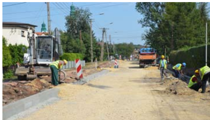
Prace są realizowane na całym odcinku drogi.

autobusowych, a także wykonanie oznakowania pionowego i poziomego na odcinku prawie 1,5 km.