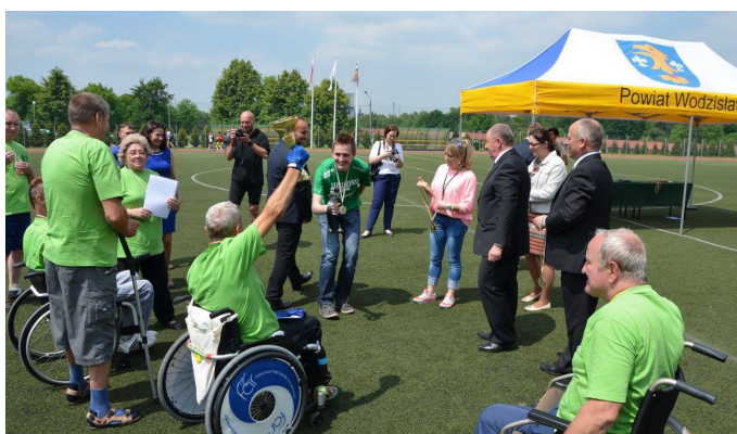
Na zakończenie olimpijskich zmagani uczestnicy otrzymali medale i puchary.