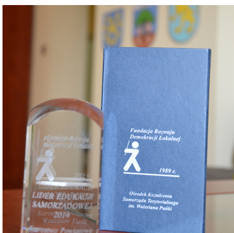
Nagroda dla Starostwa Powiatowego tzw. Walerka.