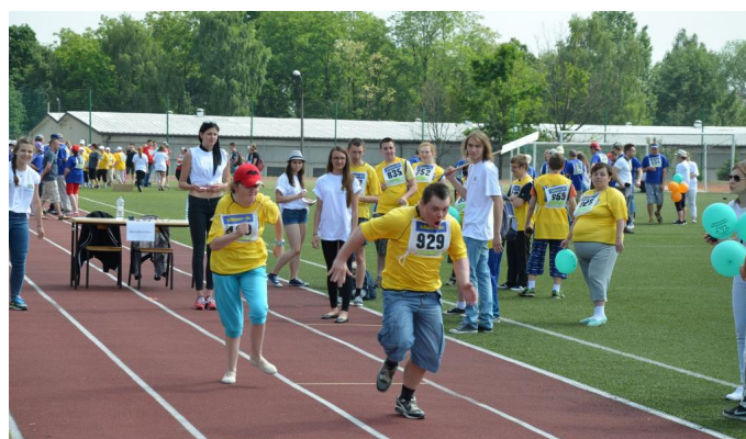
Bieg sprinterski na dystansie 30 metrów.