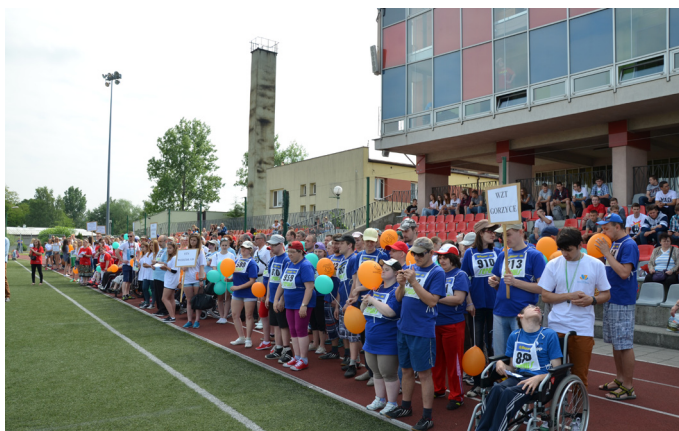
Uroczyste rozpoczęcie Olimpiady i prezentacja ośrodków.