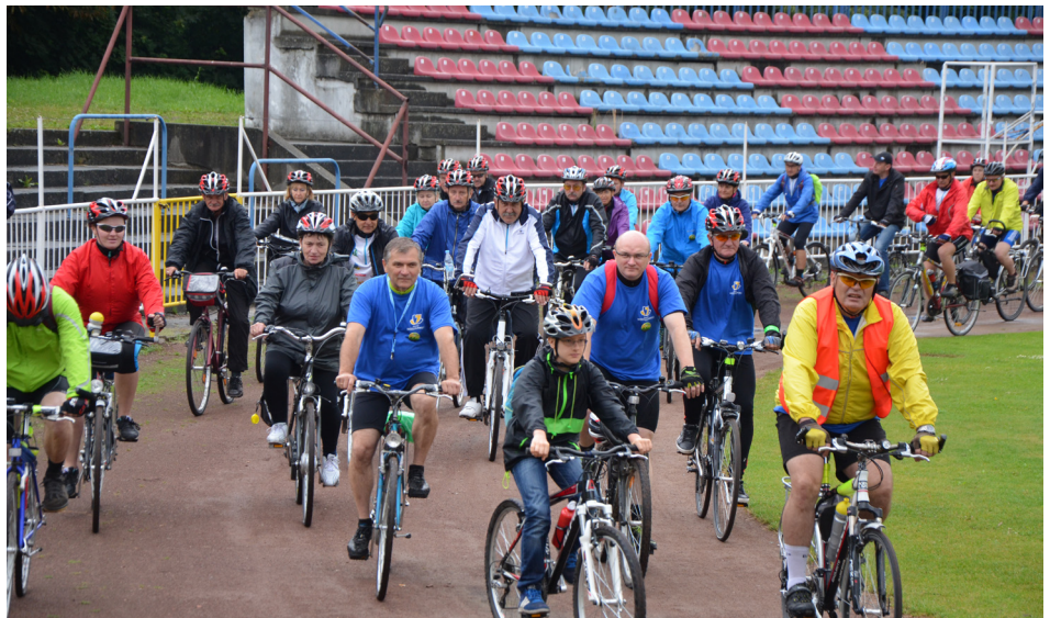
Miłośnicy dwóch kółek w trasę wyruszyli ze stadionu w Wodzisławiu Śląskim.

Po trzygodzinnej jeździe uczestnicy rajdu – zmęczeni, ale szczęśliwi – przyjechali na metę, którą zlokalizowano przy kompleksie rekreacyjno – sportowym w Godowie. Tam na rowerzystów czekały dodatkowe atrakcje. Najpierw można było się posilić kiełbasą z grilla, a później wziąć udział w konkurencjach sportowych, które przygotowali członkowie STR „Koło” z Pszowa.