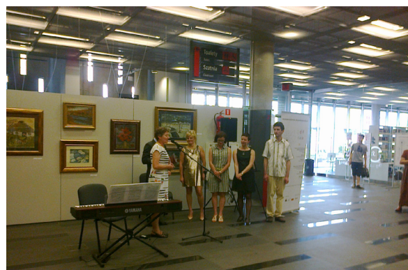
Prezentacja prac ośrodka „Perła” podczas wystawy w Katowicach.

Z folderu wystawowego: „Oderwani od nudy, monotonii i szarej codzienności nieustające-