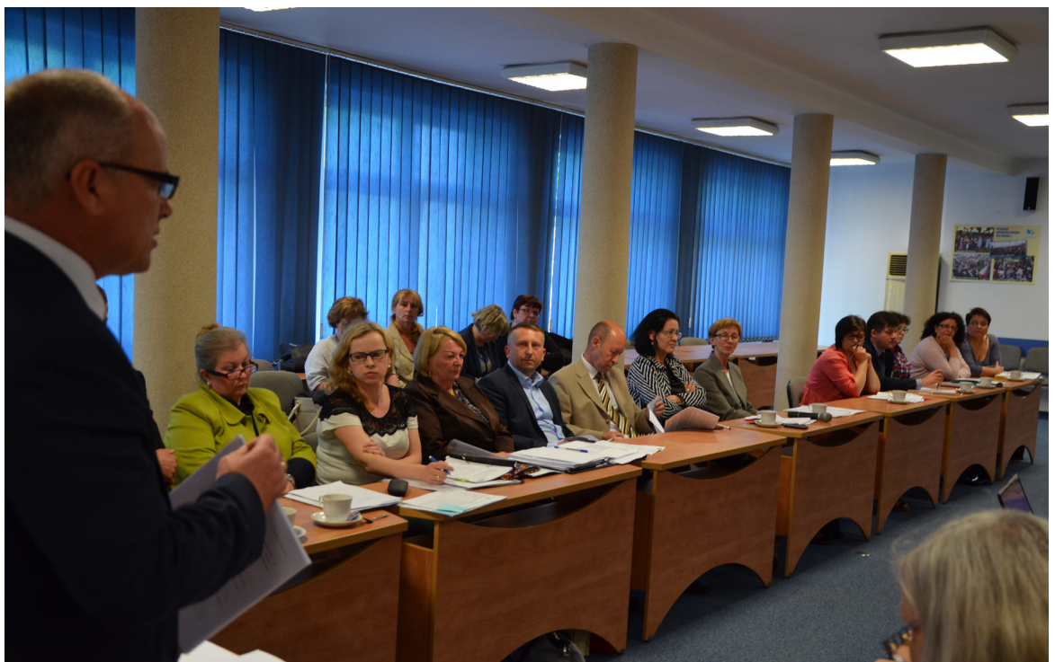
Jedno z posiedzeń zespołu roboczego.

Wydział nadzoru nad systemem zdrowotnym Śląskiego Urzędu Wojewódzkiego w Katowicach, po zapoznaniu się z propozycjami łączenia jednoimiennych oddziałów uznał, że takie działania przyniosą zamierzony efekt ekonomiczny, bez ograniczenia dostępności do świadczeń zdrowotnych.