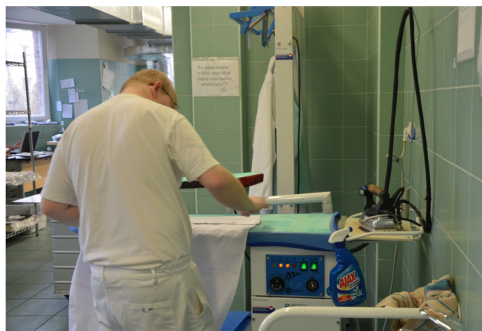
Zakład Aktywności Zawodowej zatrudnia 34 osoby z niepełnosprawnością.

Co ważne, w Zakładzie Aktywności Zawodowej osoby niepełnosprawne znajdują nie tylko pracę, ale również profesjonalną rehabilitację zawodową, zdrowotną i społeczną . Dzięki temu niektórym pracownikom udało się znaleźć pracę na otwartym rynku pracy. W 2014 r. były 3 takie osoby. Równie ważny jest aspekt edukacyjny. Pracownicy Zakładu od wielu lat uczestniczą bowiem w różnorodnych inicjatywach mających na celu zmianę mentalności społecznej w zakresie postrzegania osób z niepełnosprawnościami.