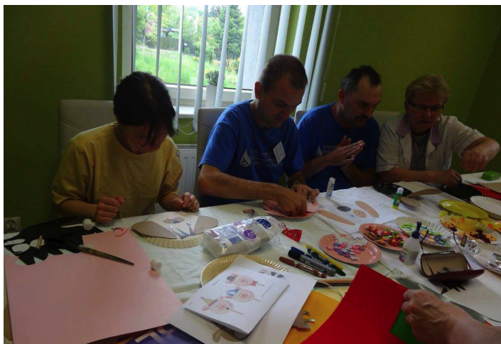
W Zakładzie prowadzona jest także rehabilitacja społeczna i zdrowotna.

Majowa sesja była okazją do podsumowania dotychczasowej działalności Zakładu Aktywności Zawodowej w Wodzisławiu Śl.