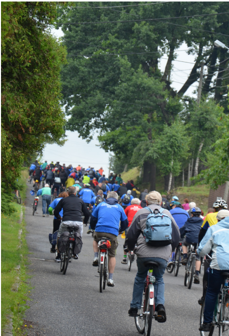
Na trasie nie zabrakło długich podjazdów.

W niedzielę, 28 czerwca, drogi powiatu wodzisławskiego opanowali rowerzyści. Byli to uczestnicy siedemnastego Powiatowego Rajdu Rowerowego.