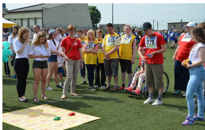
Jedna z konkurencji - rzut woreczkiem do celu.