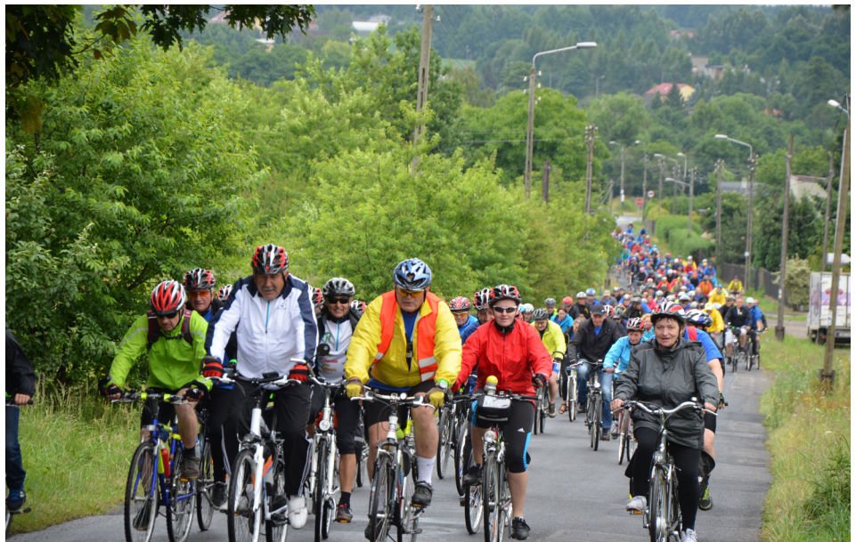
Cykliści mieli do pokonanie trasę na dystansie 28 km.

O 10:40 pod eskortą policji, straży pożarnej i ratowników medycznych rowerzyści wyruszyli w prawie trzydziestokilometrową trasę. Wiodła ona z centrum Wodzisławia Śląskiego przez Jedłownik, Kokoszyce, Czyżowice, Gorzyce,