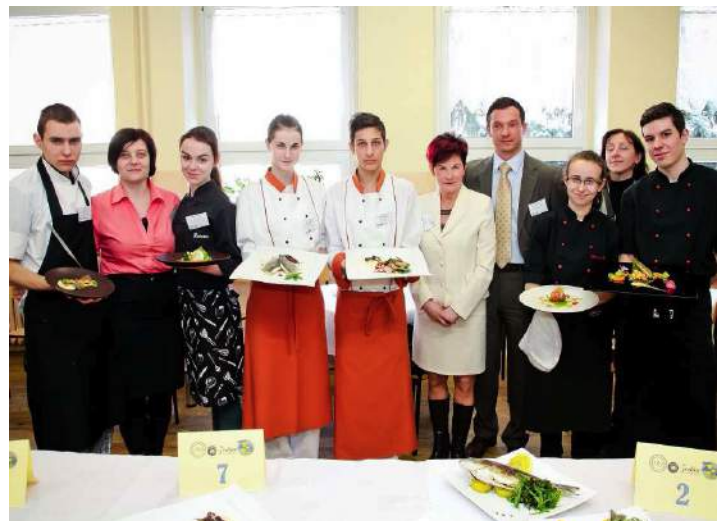
Zwycięcy konkursów wraz opiekunami.