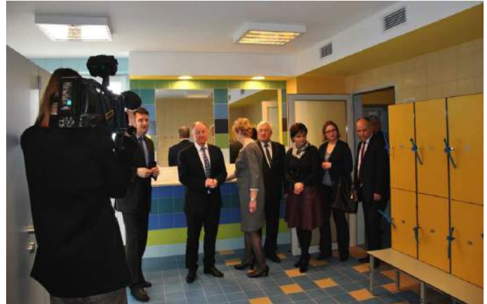
Wyremontowane szatnie są bardzo przestronne i kolorowe.

wszystkich mieszkańców powiatu. Harmonogram korzystania z basenu znajduje się na www.obiekt-sportowy.zstwodzislaw.net .