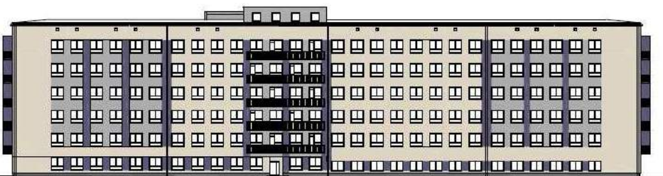
Elewacja projektu termomodernizacji szpitala od strony południowo - wschodniej.

W ramach funkcjonującego w Starostwie Powiatowym w Wodzisławiu Śląskim Systemu Zarządzania Jakością wg ISO 9001:2008, w terminie od 20 marca 2015 r. do 20 czerwca 2015 r. przeprowadzone zostanie badanie satysfakcji klienta z poziomu usług świadczonych w starostwie. - Jako urząd chcemy ciągle podnosić jakość naszej pracy. Naszym priorytetowym zadaniem jest zaspokojenie potrzeb i oczekiwań naszych klientów, rzetelne i terminowe załatwienie wszystkich spraw prawnie przewidzianych i statutowo przypisanych Starostwu – mówi starosta Tadeusz Skatuła. Zgłoszone sugestie i uwagi klientów pozwolą nam poprawić współpracę pomiędzy mieszkańcami powiatu i pracownikami Starostwa. Badanie satysfakcji klientów jest w pełni anonimowe, a jego wyniki są zliczane i przedstawiane wyłącznie w zbiorczych zestawieniach statystycznych. Wypełnione ankiety będzie można składać do specjalnych skrzynek oznaczonych napisem „ANKIETY”, znajdujących się w Punktach Obsługi Klienta oraz poszczególnych wydziałach w Starostwie Powiatowym w Wodzisławiu Śląskim przy ul. Bogumińskiej 2, ul. Pszowskiej 92 a, jak również przy ul. Mendego 3 lub wypełnić on-line na naszej stronie internetowej.