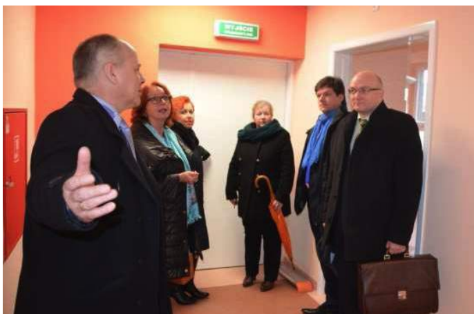
Członkowie zarządu powiatu z wizytą w wyremontowanym oddziale neurologicznym z pododdziałem urazowym.