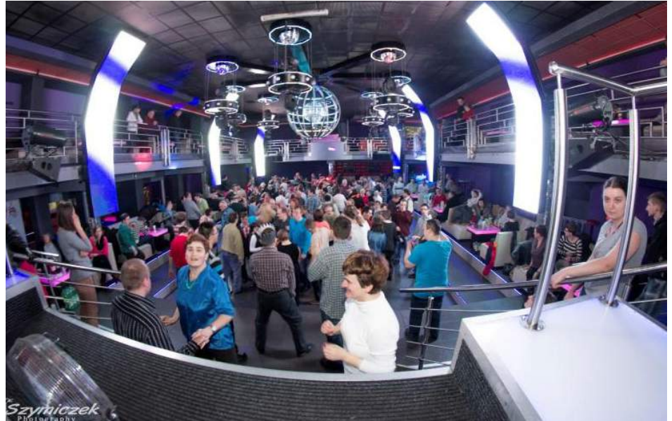
Uczestnicy zabawy mogli potańczyć w rytm znanych i lubianych przebojów.

Karnawał to czas świętowania, hucznych zabaw i kolorowych bali. Wspaniałe imprezy karnawałowe dla osób niepełnosprawnych zorganizowały Warsztaty Terapii Zajęciowej Św. Hiacynta i Franciszek z Wodzisławia Śląskiego i Powiatowy Ośrodek Wsparcia „Per-