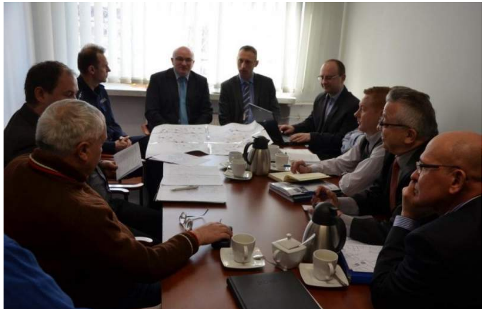
Członkowie komisji pracowali na nową organizacją ruchu w centrum Wodzisławia Śląskiego.