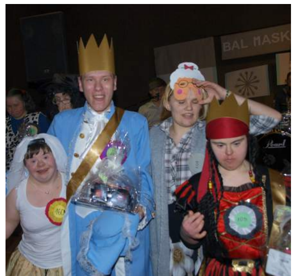
Na balu karnawałowym nie zabrakło ciekawych i oryginalnych strojów.