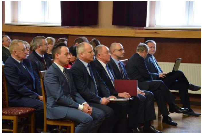
Robocze spotkanie konsultacyjne w sprawie nowej strategii rozwoju powiatu.