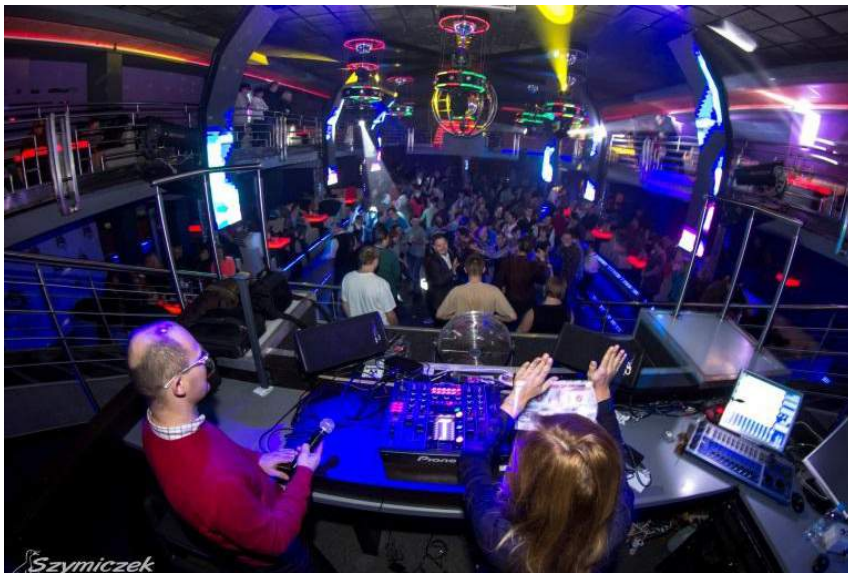
Dyskoteka odbyła się w klubie MAGIC w Krzyżanowicach.

ła” z Wodzisławia Śląskiego. Pierwsza z nich, dyskoteka w krzyżanowickim klubie „Magic”, była już piątą edycją imprezy adresowanej do niepełnosprawnych mieszkańców powiatu wodzisławskiego i okolicznych miast. Uczestnicy bawili się przy muzyce serwowanej przez profesjonalnych DJ-ów: Anetusa i Gąsiora. Drugą z nich, Karnawałowy Bal Maskowy, od dwunastu lat organizuje Powiatowy Ośrodek Wsparcia „Perła”. Do czyżowickiego domu kultury przyjechały zaprzyjaźnione ośrodki z powiatu wodzisławskiego oraz podopieczni z ośrodków z Bielska-Białej i Rybnika. Wspaniałą zabawę oraz dobrą atmosferę zapewniło Stowarzyszenie Muzyczno-Kulturalne „ZOFIÓWKA”. Podczas balu odbywały się liczne konkursy oraz loterie fantowe z nagrodami. Tradycyjnie, jak co roku, każdy uczestnik mógł się wykazać pomysłem na oryginalne przebranie, a najlepsze kostiumy zostały nagrodzone.