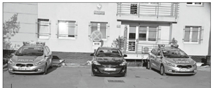
Dofinansowanie zakupu nowego nieoznakowanego samochodu.

sprzęt. W 2012 r. wodzisławscy strażacy otrzymali nowy średni samochód gaśniczy. Na jego zakup powiat przeznaczył 350 tys. zł . Z kolei z końcem ubiegłego roku na wyposażenie Komendy Powiatowej Państwowej Straży Pożarnej trafił nowy samochód rozpoznawczo-ratowniczy Nissan Navara. Całkowity koszt pojazdu wyniósł ok. 100 tys. zł , z czego połowę sfinansowało Starostwo Powiatowe.