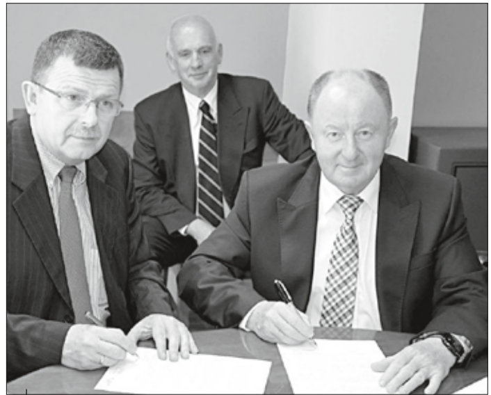
Podpisanie umowy na przejęcie udziałów przez Powiat Wodzisławski w raciborskim PKS-sie.

Skoro mówimy o infrastrukturze drogowej, nie sposób nie wspomnieć o transporcie zbiorowym. W 2011 r. Powiat Wodzisławski, jako jeden z pierwszych w naszym województwie, z sukcesem zorganizował powiatowy transport zbiorowy na terenie trzech południowych gmin: Gorzyc, Godowa i Lubomi. Początkowo było to sześć linii, a od stycznia 2012 r. doszły kolejne trzy i dzisiaj Starostwo Powiatowe w Wodzisławiu Śl. organizuje komunikację łącznie na dziewięciu liniach. 13 czerwca 2013 r. podpisano umowę, na mocy której Powiat Wodzisławski objął udziały w Przedsiębiorstwie Komunikacji Samochodowej w Raciborzu . Dzięki temu wodzisławskie starostwo mogło powierzyć transport sprawdzonej i rzetelnej firmie zatrudniającej także mieszkańców naszego powiatu oraz dotować nierentowne linie i kursy nawet do najmniejszych miejscowości powiatu, takich jak Buków, Uchylsko czy Skrbeńsko.