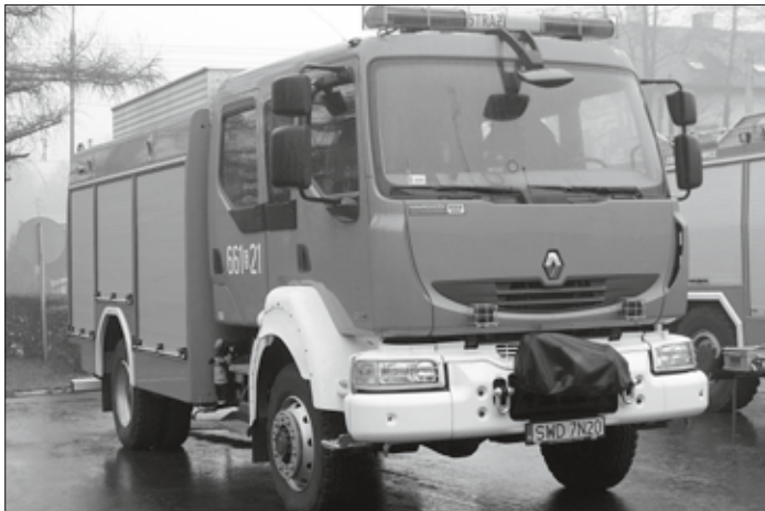
Samochód pożarniczy tzw. pierwszego wyjazdu posiada zbiornik na wodę o pojemności 2500 litrów.

powiatu kolejne 36 tys. zł na dofinansowanie zakupu radiowozu. Dodatkowo w ramach kampanii „ Z młodym kierowcą w drodze po doświadczenie ” wodzisławscy policjanci otrzymali m.in. laptop, aparaty cyfrowe do dokumentowania zdarzeń drogowych oraz alco-sensor, dzięki któremu policjanci mogą w krótkim czasie przebadać dużą ilość kierowców na zawartość alkoholu w wydechym powietrzu.