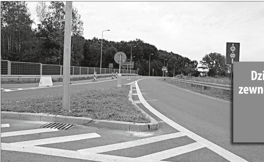
Dojazd do autostrady w Gorzyckach.

wanie dokumentacji na budowę nowej drogi do strefy inwestycyjnej w Wodzisławiu Śląskim ( łącnika odciążającego ul. Oraczy ) i zadeklarowaliśmy przekazanie 400 tys. zł na tę inwesty-