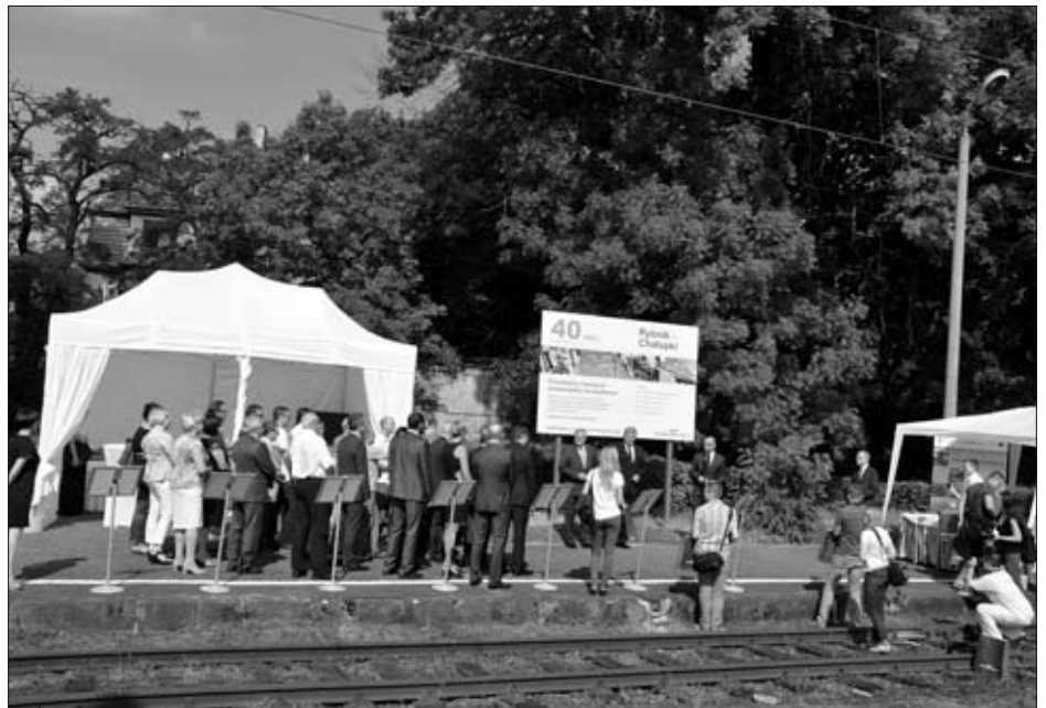
Podpisanie umowy odbyło się na dworcu w Wodzisławiu Śl.

pochodzi z budżetu UE, już w drugiej połowie 2015 r. przejazd 32 km trasy z Rybnika do Chałupki ma zająć 40 minut, a co ważniejsze – nasz powiat ma szansę skomunikować się z dużym węzłem kolejowym w Bogumińcu . To ogromna szansa na rozwój, mając na uwadze, że niemal równoległe do trasy kolejowej biegnie autostrada A-1, a w odległości ok. 100 km od granic naszego powiatu znajdują się aż trzy międzynarodowe lotniska . W ramach inwestycji przebudowanych zostanie 13 peronów , które otrzymają nowe oświetlenie, wiaty dla podróżnych, zegary i megafony do zapowiadania. Co ważne, nowa infrastruktura zostanie dostosowana do potrzeb osób niepełnosprawnych , a stacje będą monitoro-