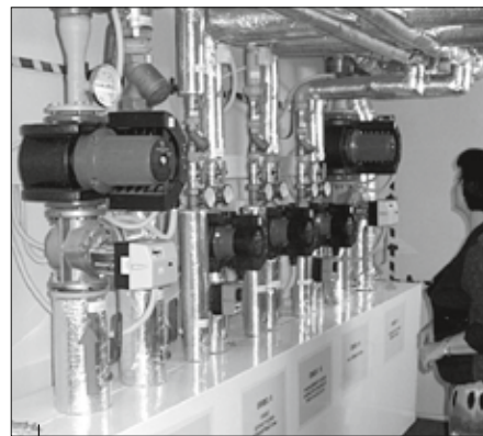
W PCKU zlikwidowano starą kotłownię węglową, a budynek podłączono do sieci ciepłowniczej. Wymieniono również instalacje wentylacyjne i wybudowano nowoczesną wymiennikownię ciepła.

◆ ponad 5 mln zł na przedsięwzięcia proekologiczne, w tym walka z azbestem i niską emisją zanieczyszczeń ◆ termomodernizacje PCKU, Powiatowego Urzędu Pracy, ośrodków zdrowia w Gorzycach, Rydułtowach, Wodzisławiu Śl., Skrzyszowie i Radlinie ◆ 632 tony substancji szkodliwych i niepożądanych w powietrzu mniej dzięki inwestycjom powiatu w ochronę powietrza