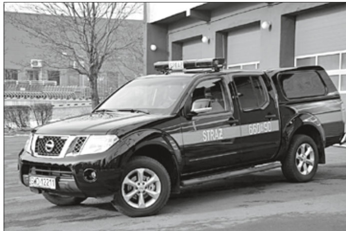
Doświadczenia ostatnich lat pokazały, że właśnie takiego środka transportu brakowało podczas wielu akcji ratowniczo-gaśniczych.