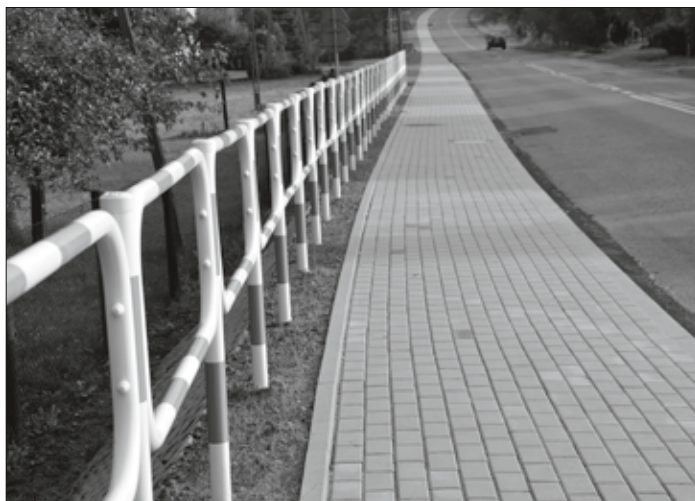
Chodnik przy ulicy 1 Maja w Mszanie.

w Wodzisławiu Śl. zainstalowano za kwotę 200 tys. zł sygnalizację świetlną. Dofinansowaliśmy również opraco-