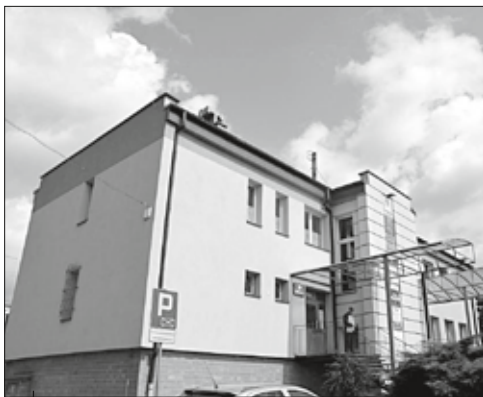
Ośrodek zdrowia w Gorzycach po remoncie

Ostatnie cztery lata to w powiecie wodzisławskim szereg inicjatyw proekologicznych. Wśród ważniejszych należy wymienić inwestycje termomodernizacyjne oraz dotacje na przedsięwzięcia proekologiczne, w tym na usuwanie i unieszkodliwianie azbestu i innych chemikaliów , remonty rowów melioracyjnych, a także na przedsięwzięcia edukacyjne.