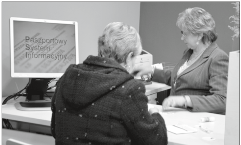
Biuro paszportowe w Wodzisławiu Śl.

Podajemy również wiele działań zmierzających do usprawniania administracji publicznej poprzez stosowanie nowoczesnych technologii. Pozyskaaliśmy ponad 2,5 mln zł na realizację projektu „ System Informacji Przestrzennej Powiatu Wodzisławskiego