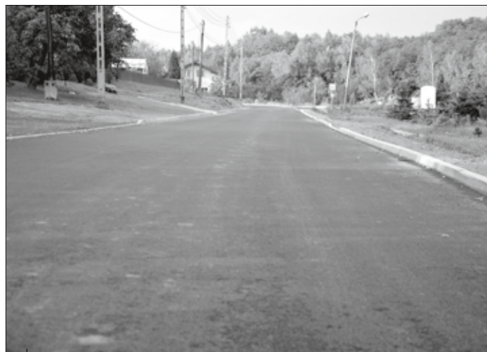
Wyremontowana ulica Wodzisławska w Krostoszowicach.