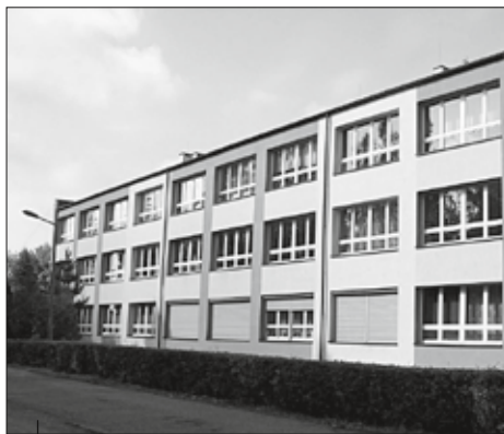
Budynek Powiatowego Centrum Kształcenia Ustawicznego po termomodernizacji.