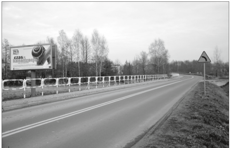
Nowa nawierzchnia na ulicy Wodzisławskiej w Czyżowicach.

nawierzchni jezdni (m.in. ul. Chrobrego, Skrzyszowskiej, Głoczyńskiej, Górnicy i Oraczy w Wodzisławiu Śl., ul. Piotrowickiej w Skrbeńsku, ul. Dworcowej w Gołkowicach, ul. Wo-