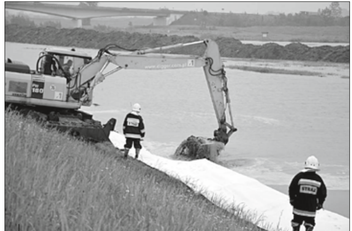
Strażacy podczas akcji wykorzystują sprzęt i materiały, które znajdują się na wyposażeniu Powiatowego Magazynu Zarządzania Kryzysowego.