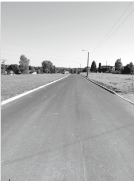
Wyremontowana ul. Głoczyńska w Wodzisławiu Śl.

wanie dokumentacji na budowę nowej drogi do strefy inwestycyjnej w Wodzisławiu Śląskim ( łącnika odciążającego ul. Oraczy ) i zadeklarowaliśmy przekazanie 400 tys. zł na tę inwesty-