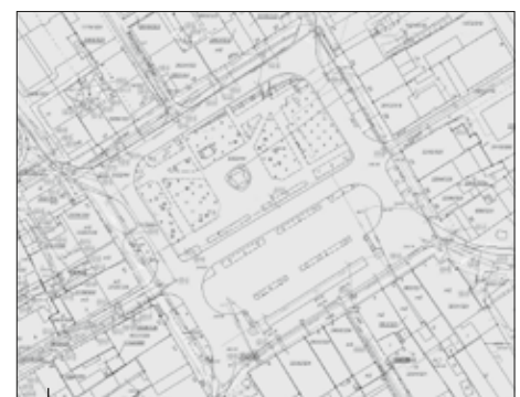
Rynek w Wodzisławiu Śl. widziany z perspektywy nowoczesnych aplikacji do zarządzania przestrzenią. Wiele informacji dostępnych w jednym miejscu i na jedno „kliknięcie” myszką.

Jako powiat wspieramy organizacje pozarządowe również poprzez istniejący w Starostwie Powiatowym Inkubator Ekonomii Społecznej . W nim lokalne stowarzyszenia, kluby sporto-