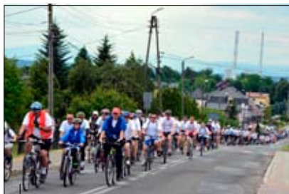
I jeszcze jeden podjazd pod górkę w Skrzyszowie.