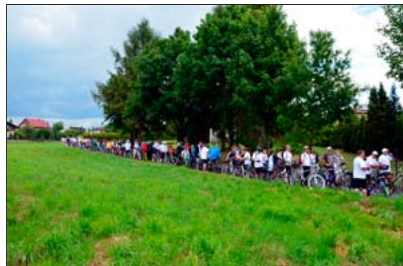
Chwila na odpoczynek połączona z komasacją grupy.