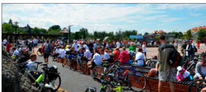
Po przejechaniu 25 km przeszedł czas na posiłek i odpoczynek na Tropikalnej Wyspie w Markłowicach.