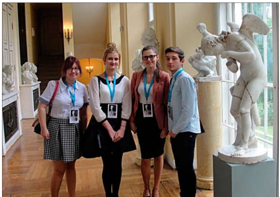
Delegacja LO im. Noblistów Polskich w Rydułtowach podczas pobytu w Warszawie.

w partnerskich krajach oraz II Nagrodą „Konkursu eTwinning 2013” w Czechach. Koordynatorowi polskiemu przyznano Europejski Znak Innowacyjności w Nauczaniu i Uczniu się Języków Obcych 2013.