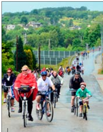
Przejazd przez most nad autostradą A1 w Krostoszowicach.