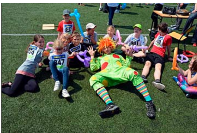
Dla uczestników przygotowano wiele atrakcji, m.in pokaz baniek mydlanych.