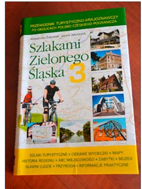
Przewodnik krajoznawczy „Szlakami Zielonego Śląska”.

granicza i turystyki w regionie, noty biograficzne kilkudziesięciu osób, informacje o muzeach i izbach pamięci, rozbudowane opisy monograficzne kilkudziesięciu miejscowości (informacje o dziejach miast i wsi, opisy zabytków, miejsc pamięci i obiektów przyrodniczych), wreszcie drobiazgowo opisy kilkunastu szlaków. Ustalenia są wynikiem kwerendy archiwalnej, lektury około tysiąca publikacji, wielu lat badań terenowych. Tekst ilustruje kilkaset zdjęć i map. Publikacja dostępna jest w księgarniach.