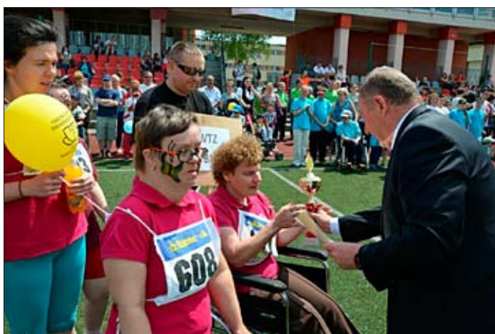
Na zakończenie olimpijskich zmagani wszystkim uczestnikom zostały wręczone medale oraz pamiątkowe puchary.

Wydawca: Starostwo Powiatowe w Wodzisławiu Śląskim, Wodzisław Śląski, ul. Bogumińska 2. Nakład: 4000 egz. Redakcja: Magdalena Kozielska, redaktor naczelny, tel. (32) 412 09 48, http://www.powiatwodzislawski.pl ; e-mail: strategia@powiatwodzislawski.pl . Skład i druk: M&Z Druk, Radlin, tel. 32 456 77 52, e-mail: poczta@mzdruk.com.pl Materiały zamieszczone w „Wieściach Powiatu Wodzisławskiego” są zastrzeżone. Redakcja nie odpowiada za treść nadsyłanej do druku korespondencji. Redakcja zastrzega sobie prawo do skracania nadesłanych tekstów oraz zmian tytułów. Redakcja nie zwraca materiałów nie zamówionych. Adres do korespondencji: Starostwo Powiatowe w Wodzisławiu Śląskim, 44-300 Wodzisław Śląski, ul. Pszowska 92 a, z dopiskiem „Wieści Powiatu Wodzisławskiego”.