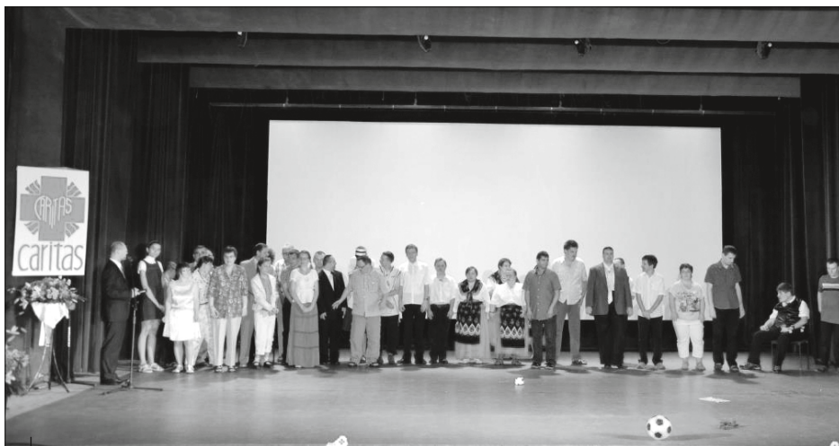
Występ uczestników warsztatu przygotowany specjalnie na jubileusz.