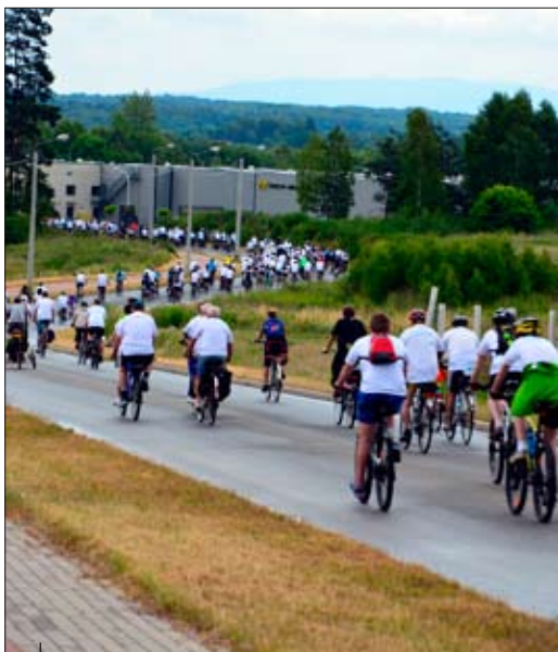
Przejazd przez strefę przemysłową w Skrzyszowie.