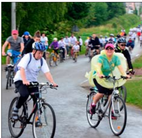
Mimo jazdy w strugach deszczu, z twarzy uczestników nie zniknął uśmiech.