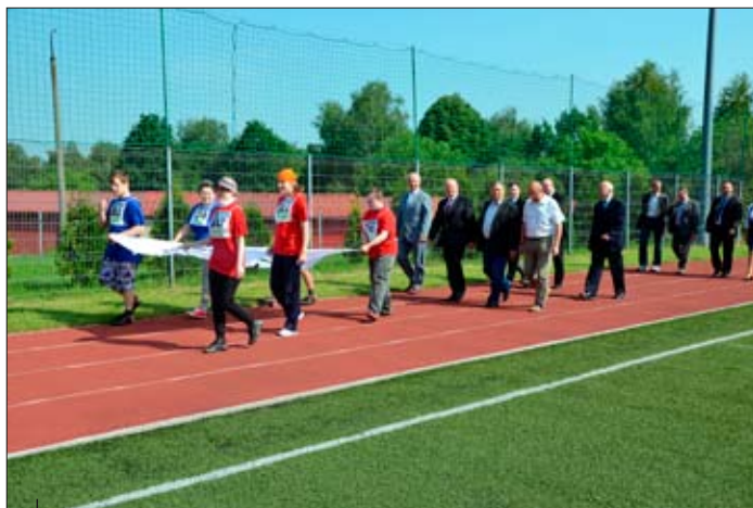
Zaproszeni goście oraz uczestnicy Olimpiady przeszli na murawę stadionu, by uroczystie odśpiewać hymn narodowy, a na maszt wciągnąć olimpijską flagę.