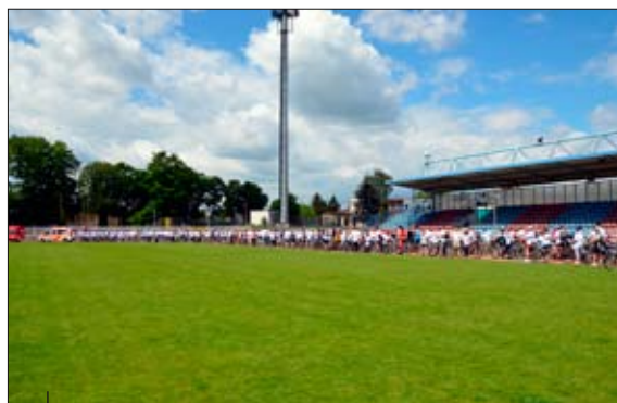
Formowanie peletonu na płycie boiska.

Sponsorem tegorocznego rajdu była firma Maximus Broker.