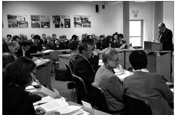
Obrady Rady Powiatu Wodzisławskiego.

5. Wyraził zgodę na przeprowadzenie postępowania o udzielenie zamówienia publicznego pod nazwą: „Przebudowa klatek schodowych wraz z zabudową urządzeń zapobiegających zadymieniu oraz częściowa wymiana więźby