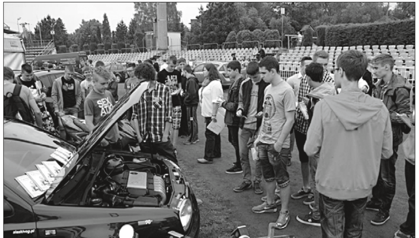
Stoiska przygotowane przez szkoły wzbudzały wielkie zainteresowanie odwiedzających targi.