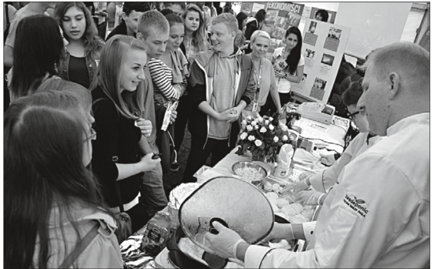
Targi zorganizowano z myślą o młodych mieszkańców powiatu, stojących przed koniecznością podjęcia decyzji o dalszej ścieżce edukacji.

W nowym roku szkolnym Powiat planuje w swoich szkołach utworzyć 47 oddziałów dla młodzieży, a także 15 dla dorosłych (w ramach Powiatowego Centrum Kształcenia Ustawicznego w Wodzisławiu Śl.). Wśród nowych kierunków są technik analityk, elektromechanik oraz operator obrabiarek skrawających.