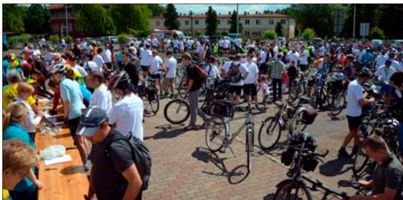
Od samego rana na placu przy MOSiR w Wodzisławiu Śl. trwały zapisy.