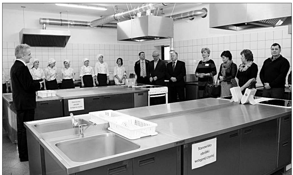
Nowa pracownia gastronomiczna w Rydułtowach.

Pod dużym wrażeniem rozmachu, z jakim zaprojektowano i wykonano nową bazę dydaktyczną dla przyszłych kucharzy i gastronomów w Rydułtowach, byli również naukowcy z Wydziału Technologii Żywności Uniwersyte-