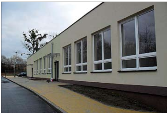
Nowa część budynku.

Dzięki środkom z Regionalnego Programu Operacyjnego Województwa Śląskiego na lata 2007-2013 od maja słuchacze i uczniowie Powiatowego Centrum Kształcenia Ustawicznego w Wodzisławiu Śląskim przy ul. Gałczyńskiego 1 zdobywać będą nowe umiejętności zawodowe w wyspecjalizowanych warsztatach i pracowniach. Całkowita wartość projektu wynosi około 5 500 000,00 zł, w tym w ramach podpisanej z Województwem Śląskim umowy, Powiat Wodzisławski otrzymał