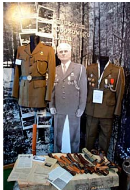
Oprócz zdjęć z obozowisk, w rydułtowskiej Izbie zgromadzono także stare mundury, menażki, mnóstwo odznak, legitymacji i innych dokumentów, a nawet starą, ale wciąż działającą radiostację polową.

W Izbie prezentowana jest wystawa materiałów związanych z historią