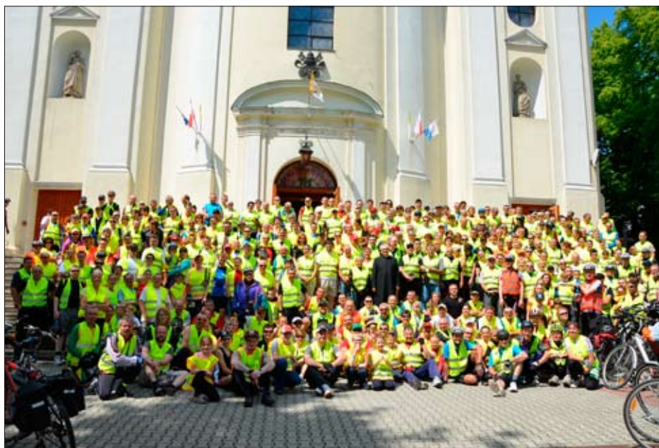
Pamiątkowe zdjęcie uczestników XV Rajdu przy Bazylice Pszowskiej.

Każdego roku, ponad 500 cyklistów z regionu wspólnie pokonuje trasę rajdu. Ponadto w dotychczas organizowanych rajdach brali udział również goście z zagranicy, między innymi z Niemiec, Szwecji i Czech. Imponującym jest również fakt, że taka forma turystyki cieszy się zainteresowaniem wśród różnych grup wiekowych, zarówno wśród młodych rowerzystów, jak i prawdziwych weteranów turystyki rowerowej, co roku stających na starcie właśnie tej imprezy. Z kolei przyjazd rowerzystów na metę, zlokalizowaną każdego roku w innym miejscu, nie oznacza zakończenia imprezy. Na uczestników czekają tam liczne atrakcje, mogą między innymi wziąć udział w konkurencjach sportowo-rekreacyjnych i zaważać o cenne nagrody. W ciągu tych piętnastu lat miłośnicy turystyki rowerowej pokonali kilkaset kilometrów i mieli możliwość zobaczyć wiele ciekawych miejsc. Udział w rajdzie rowerowym to nie tylko okazja do aktywnego spędzenia czasu, ale również do poznania najcenniejszych zabytków znajdujących się na naszym terenie.