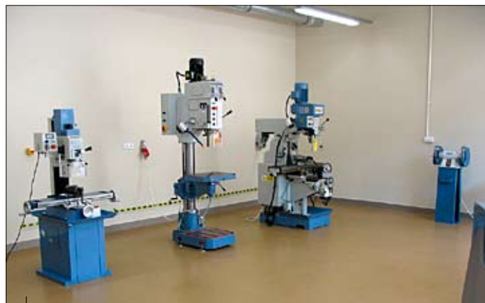
Na zdjęciu m.in. wiertarka kadłubowa i frezarka uniwersalna.

Nowoczesny obiekt umożliwi osobom dorosłym oraz uczniom szkół technicznych i zawodowych rozwijanie kompetencji w formach szkolnych i pozaszkolnych w następujących branżach: – mechaniczno- górniczej, – elektryczno – elektronicznej, – administracyjno – usługowej. Aby sprostać