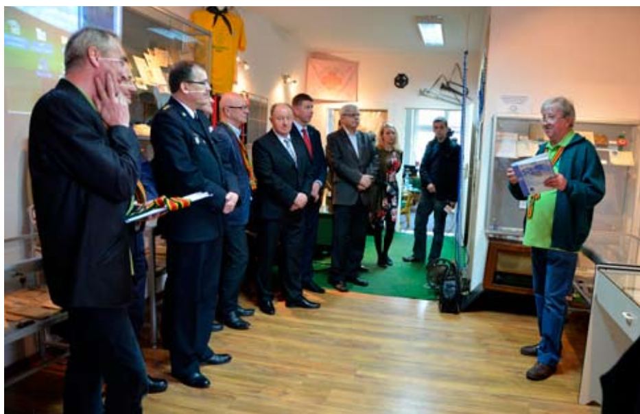
Oficjalne otwarcie Izby Harcerskiej w Rydułtowach.

harcerstwa na ziemi wodzisławskiego. Unikatowe ekspozyty pokazują początki ruchu harcerskiego, a także jego losy na przestrzeni lat powojennych. Placówka znajduje się przy ul. Ofiar Terroru 61 . Czynna jest w czwartki w godzinach od 17:30 do 19:00 oraz na indywidualnie umówiony termin. Kontakt: e-mail: czuwaj.rydułtowy@gmail.com