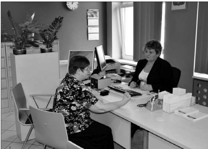
Biuro paszportowe cieszy się dużym zainteresowaniem.