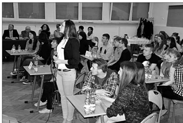
Uczestnicy konkursu odpowiadali na specjalnie przygotowane pytania.