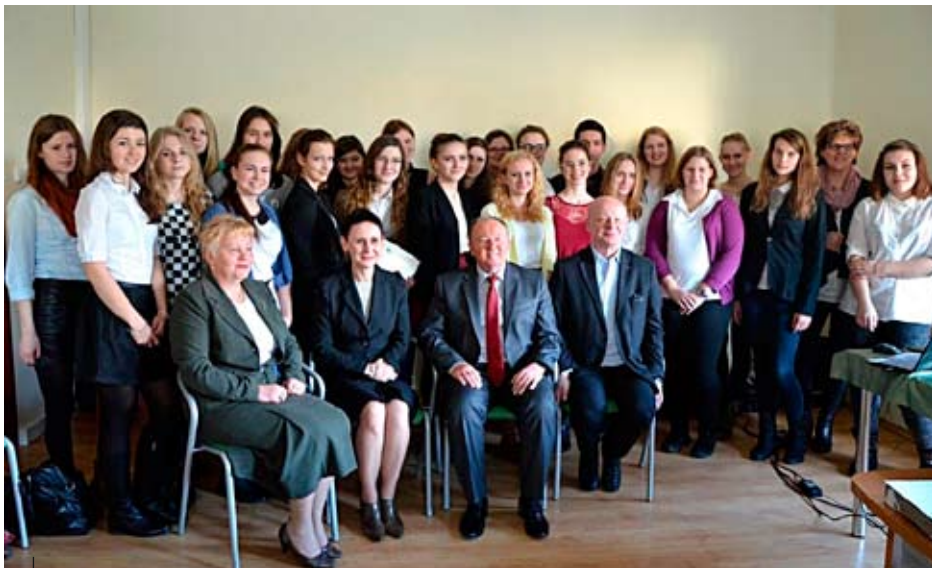
Nowa grupa wolontariuszy.

Są młodzi, energiczni i swoją pomoc chcą okazać osobom potrzebującym. Mowa o uczennicach i uczniach Zespołu Szkół im. 14 Pułku Powstańców Śląskich w Wodzisławiu Śl., którzy w Powiatowym Centrum Pomocy Rodzinie w Wodzisławiu Śl. utworzyli kolejną w powiecie wodzisławskim grupę wolontariuszy.