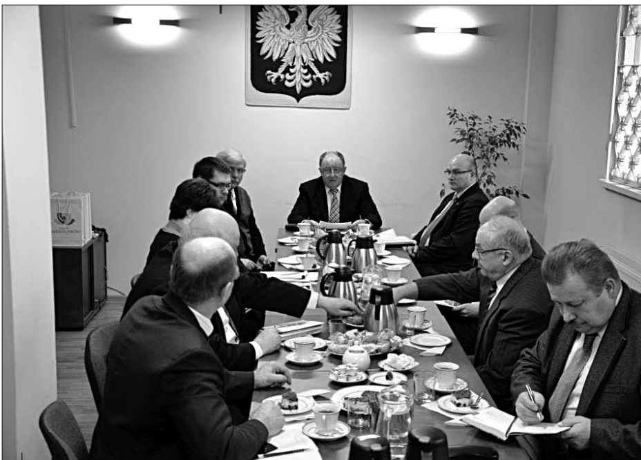
Spotkanie z przewodniczącymi rad dzielnic Wodzisławia Śl.

Sprawy dróg poruszali także przedstawiciele dzielnic. Zaapelowali m.in. do starosty oraz do uczestniczącego w spotkaniu wiceprezydenta Dariusza Szymczaka o wsparcie działań dzielnic na rzecz remontu dróg wojewódzkich na terenie miasta. Starosta przypomniał, że władze Powiatu już od kilku lat walczą o modernizację tych dróg. Zapowiedział też, że Zarząd Powiatu oraz Powiatowy Zarząd Dróg po raz kolejny zwrócą się do Zarządu Dróg Wojewódzkich w Katowicach oraz władz regionu o pilne uwzględnienie w planach remontowych dróg na terenie powiatu, w szczególności skrzyżowań ul. Kopernika – Jastrzęb-