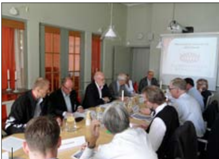
Wspólnie z naszymi zagranicznymi partnerami realizujemy projekty, na które pozyskujemy środki zewnętrzne.

prowadzi Powiat oraz faktu, iż znaczna część z nich jest finansowana w całości lub w dużej części ze środków zewnętrznych. W ramach rewizyty w Recklinghausen pracownicy instytucji pomocy społecznej naszego powiatu we wrześniu 2012 r. poznawali doświadczenia niemieckie i szwedzkie w walce z przemocą w rodzinie. W maju zaś wspólnie z powiatem Recklinghausen i Soermland świętowaliśmy dwudziestolecie współpracy naszych zagranicznych partnerów. W maju tego roku delegacje obu zaprzyjaźnionych samorządów odwiedzą nasz powiat.