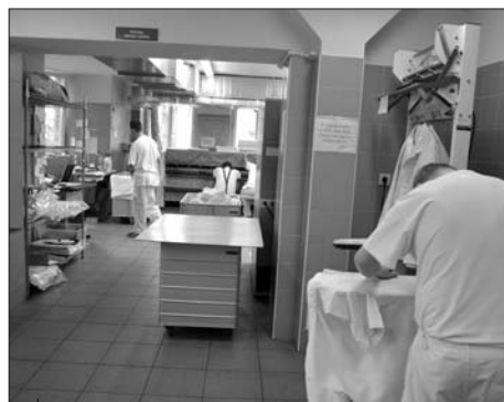
Dzięki planowanej rozbudowie Zakładu Aktywności Zawodowej prace może znaleźć dodatkowych 6 do 10 niepełnosprawnych mieszkańców naszego powiatu.

ku pracy. Wynegocjowaliśmy ponadto z Wojewodą Śląskim poszerzenie oferty i liczby miejsc z 25 do 30 w Powiatowym Ośrodku „Perła”, który w znacznej części jest finansowany ze środków z budżetu państwa.