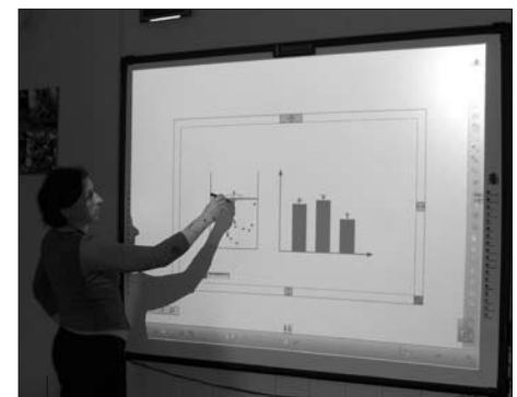
Podczas lekcji matematyki lub biologii uczniowie mogą korzystać z tabletek czy tablic interaktywnych.

W Zespole Szkół Ekonomicznych została zmodernizowana i doposażona pracownia technologii gastronomicznej oraz pracownia hotelarska, a w Zespole Szkół Technicznych doposażono pracownię kosztorysowania i projektowania oraz przedsiębiorczości. W Zespole Szkół Ponadgimnazjalnych nr 2 w Rydułtowach zmodernizowano i doposażono natomiast pracownię obsługi klienta, w Zespole Szkół Ponadgimnazjalnych w Pszowie – elektrotechniki i elektroniki samochodowej, a w Zespole Szkół Ponadgimnazjalnych im.