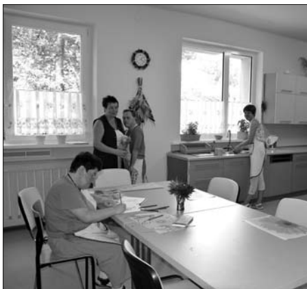
Jedna z nowych pracowni w Warsztacie Terapii Zajęciowej Św. Franciszek i Hiacynta w Wodzisławiu Śl.

Udało się nam też doprowadzić do zwiększenia do 20 liczby miejsc pracy w Zakładzie Aktywności Zawodowej – Zakładzie Usług Pralniczych w Wodzisławiu Śl. dla najbardziej niepełnosprawnych mieszkańców naszego powiatu, którzy praktycznie nie mają szans na znalezienie pracy na otwartym ryn-