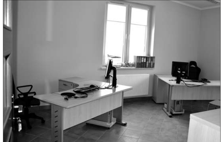
Wyremontowane pomieszczenia w Powiatowym Urzędzie Pracy.

znajdującego się w sąsiedztwie Powiatowego Urzędu Pracy i kosztem 855 tys. zł rozpoczęliśmy proces jego adaptacji dla potrzeb Centrum Aktywizacji Zawodowej . Podobnie jak w przypadku innych naszych inwestycji także i na to przedsięwzięcie pozyskaliśmy znaczne – bo wynoszące aż 40% wartości (336 tys. zł) – dofinansowanie ze środków zewnętrznych. Dzięki temu już wkrótce osoby korzystające z usług urzędu pracy będą obsługiwane w znacznie lepszych warunkach.