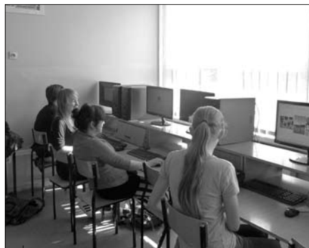
Uczniowie korzystają z nowoczesnych pracowni komputerowych.

Nie może więc dziwić dążenie Zarządu i Rady Powiatu Wodzisławskiego do rozwoju naszego społeczeństwa, w szczególności młodego pokolenia, poprzez liczne proedukacyjne inwestycje, a takich w 2012 r. nie brakowało. Z końcem października zakończono termomodernizację Powiatowego Centrum Kształcenia Ustawicznego w Wodzisławiu Śląskim . W rezultacie tej inwestycji nie tylko poprawiono komfort cieplny obiektów, ale wyeliminowano też emisję do środowiska szkodliwych substancji, a co najważniejsze – przy całkowitym koszcie przedsięwzięcia wynoszącym 2,6 mln zł pozyskaliśmy na ten cel wsparcie finansowe z Wojewódzkiego Funduszu Ochrony Środowiska i Gospodarki Wodnej w Katowicach w formie dotacji (361 tys. zł) i niskooprocentowanej pożyczki (ok. 1,3 mln zł). Zakończenie termomodernizacji PCKU w Wodzisławiu Śl. oznacza, że wszystkie powiatowe szkoły na terenie Wodzisławia Śl. zostały już poddane temu procesowi. Wpływa to znacząco na poprawę jakości powietrza, jakim oddychamy, ale też ma przynieść wymierne