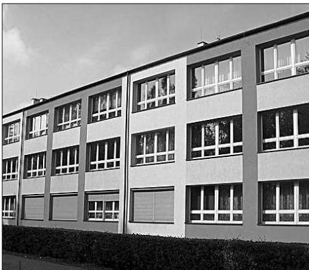
Ponad 4 mln. 200 tys. zł pozyskaliśmy na rozbudowę i modernizację Powiatowego Centrum Kształcenia Ustawicznego w Wodzisławiu Śl.

które będą mogły pełnić funkcje sal wystawowych. Już dzisiaj uczniowie tej szkoły oraz II LO korzystają natomiast z nowoczesnej komputerowej pracowni grafiki, fotografii i filmu, a także z kilkunastu pracowni multimedialnych.