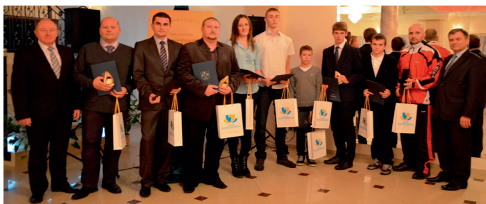
Wyróżnieni w Dziedzinie Sportu