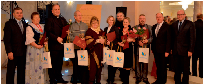
Laureaci Nagrody Powiatu Wodzisławskiego w Dziedzinie Kultury

Wszystkim nagrodzonym gratulujemy i życzymy kolejnych sukcesów.