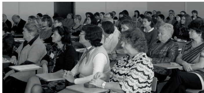
Uczestnicy IV Regionalnego Forum Edukacyjnego