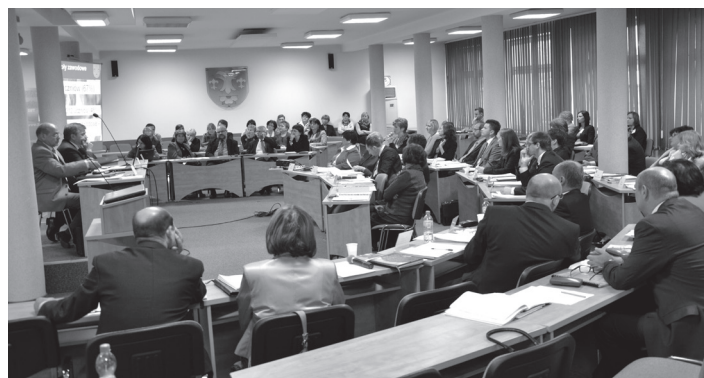
Obrazy październikowej sesji Rady Powiatu Wodzisławskiego

Ponadto Zarząd Powiatu zapoznał się z założeniami do projektu budżetu Powiatu Wodzisławskiego na 2013 rok i polecił Skarbnikowi Powiatu przygotowanie stosownego projektu uchwały na podstawie udzielonych wytycznych w zakresie ograniczenia wydatków w poszczególnych rodzajach klasyfikacji budżetowej.