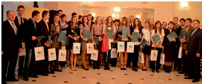
Laureaci Nagrody Powiatu Wodzisławskiego w Dziedzinie Sportu