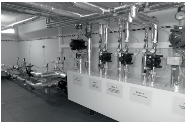
Starą kotłownię węglową zastąpiła nowoczesna wymiennikownia ciepła

Inwestycja ta przyczyni się nie tylko do poprawy komfortu cieplnego budynku, ale wpłynie na jakość powietrza atmosferycznego w najbliższej okolicy poprzez likwidację tzw. „niskiej emisji”. Już dzisiaj widoczne są efekty modernizacji. - Na razie jesteśmy jeszcze na etapie ustawiania i optymalizowania całego układu