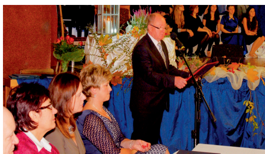
Jedną z uroczystości organizowanych przez Wydział są obchody Dnia Edukacji Narodowej

zatrudnionych nauczycieli oraz realizacja dodatkowych zadań, takich jak np. nauczanie indywidualne przyznane przez poradnię. Dane te są przysyłane przez poszczególne szkoły/ placówki do Wydziału, a następnie weryfikowane i przekazywane dalej do MEN. Analizą materiałów z Ministerstwa Edukacji Narodowej dotyczącą naliczania subwencji oświatowej zajmuje się Referat Ekonomiczny. Do jego zadań należy sporządzanie analizy poniesionych w danym roku wydatków na wynagrodzenia nauczycieli, w odniesieniu do wysokości średnich wynagrodzeń, opracowywanie analiz ekonomicznych dla potrzeb Wydziału związanych z realizowanymi przez szkoły zadaniami oraz bieżący nadzór nad realizacją budżetu wykonywanego przez podległe szkoły i placówki oświatowe.