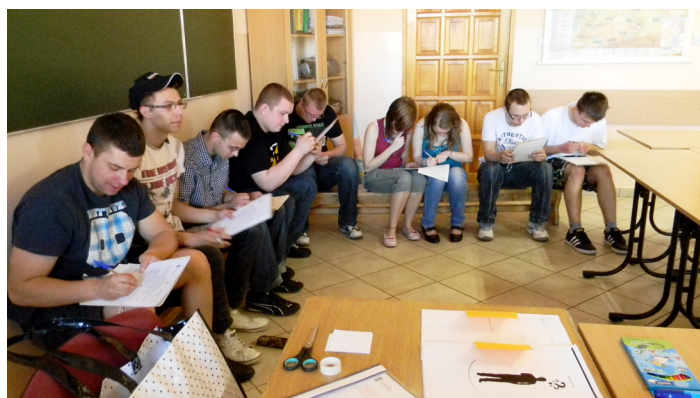
Młodzież podczas zajęć z doradztwa grupowego

Od 4 września do 5 października 2012 r. Starostwo Powiatowe przeprowadzi drugi nabór kandydatów do projektu systemowego pn. „Mam zawód – mam pracę w regionie”. Do udziału w projekcie mogą się zgłaszać uczniowie klas II, III i IV techników oraz II i III zasadniczych szkół zawodowych. Skierowany jest do młodzieży z terenu powiatu wodzisławskiego, która nie uczestniczyła w pierwszym naborze. Projekt gwarantuje uczestnikom udział w bezpłatnych formach wsparcia, do których należą zajęcia z doradztwa zawodowego grupowego, zawodowego indywidualnego, kursy certyfikowane m.in. z SEP, programowania i obsługi maszyn CNC, spawacza mag, prawa jazdy kat. B, operatora koparki, operatora wózków widłowych, carvingu, programów finansowo – księgowych, ECDL Core; staże/praktyki m.in. w branżach: informatycznej, gastronomicznej, hotelarskiej, mechanicznej, elektronicznej; zajęcia wyrównawcze m.in. z matematyki, fizyki, informatyki, chemii, języka polskiego, zajęcia pozaszkolne m.in. z języka angielskiego, technologii informacyjno-komunikacyjnej ICT, projektowania stron www, systemów i sieci komputerowych, technologii mobilnych, kursy on-line na platformie e-learningowej - kursy przygotowujące do matury, kursy wyrównujące dysproporcje edukacyjne oraz kursy dodatkowe,