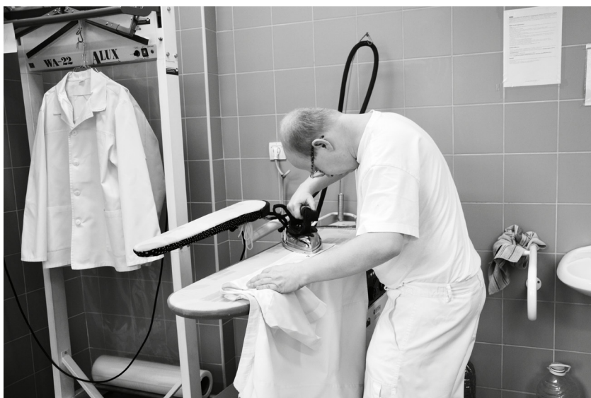
Zakład zatrudnia pracowników na stanowiskach pracza, maglarza i prasowacza (na zdjęciu)