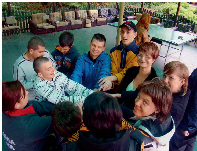
Uczestnicy programu „Dobry Start” podczas warsztatów