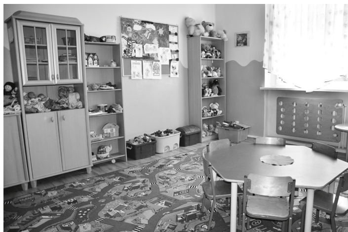
Pokój zabaw dla dzieci

Osoby doświadczające przemocy postrzegają siebie jako osoby bezwartościowe, nieatrakcyjne, niezaspakajane na miłość i szacunek. W swoich zachowaniach są uległe i podporządkowane. Odczuwają