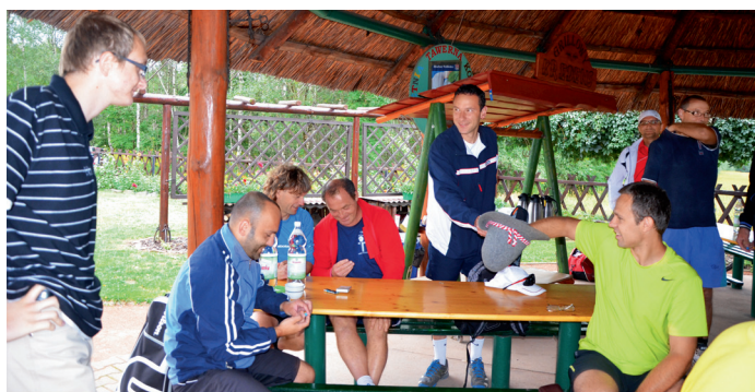
Zanim zawodnicy przystąpili do rywalizacji sportowej odbyło się losowanie