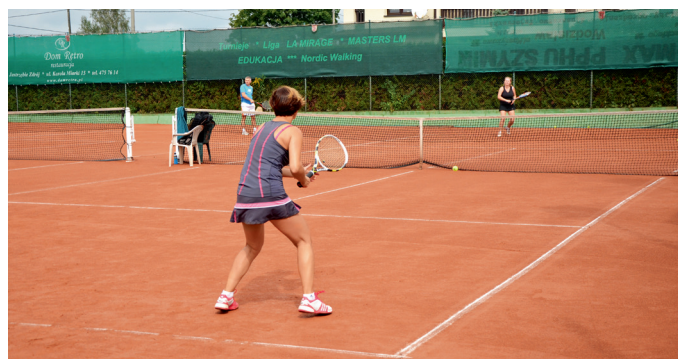
Turniej rozegrany został w dwóch kategoriach: mężczyźni i kobiety