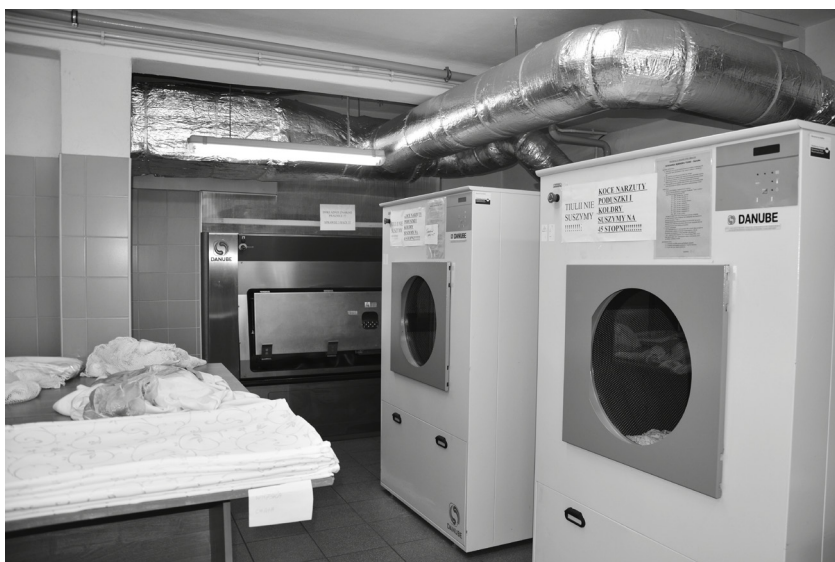
Zakład wyposażony jest w nowoczesny sprzęt pralniczy

wiodącą rolę w przyszłym poszukiwaniu zatrudnienia oraz aktywności na otwartym rynku pracy.