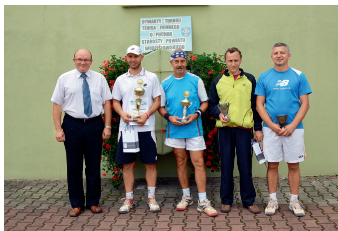
Zwycięzcy turnieju w kategorii mężczyzn z Wicestarostą Dariuszem Prusem