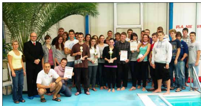
Uczestnicy VIII Drużynowych Zawodów Pływackich Szkół Ponadgimnazjalnych

Wyniki można sprawdzić na stronie www.powiatwodzislawski.pl w zakładce aktualności. (WSR)