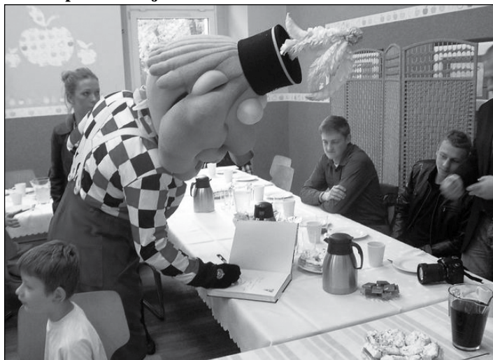
Delegacja piłkarzy Górnika Zabrze i ich klubowa maskotka Jorgus podczas wizyty w Powiatowym Domu Dziecka w Gorzyczkach

To był wyjątkowy dzień, na który wszystkie dzieci czekały z niecierpliwością. 20 października Powiatowy Dom Dziecka w Gorzyczkach odwiedziła delegacja piłkarzy Górnika Zabrze wraz ze swoją maskotką klubową „Jorgusiem”. Spotkanie odbyło się z inicjatywy wychowanków, którzy są wielkimi fanami piłki nożnej.