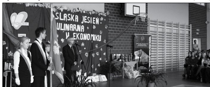
Uroczyste otwarcie wyremontowanej sali gimnastycznej