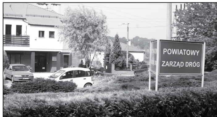
Siedziba Powiatowego Zarządu Dróg w Syryni

czące zasypanych dróg i chodników. Obszar działania Powiatowego Zarządu Dróg obejmuje sieć dróg zaliczonych do kategorii dróg powiatowych o łącznej długości ponad 205 km oraz 25 obiektów mostowych. (BRZ, WSR)