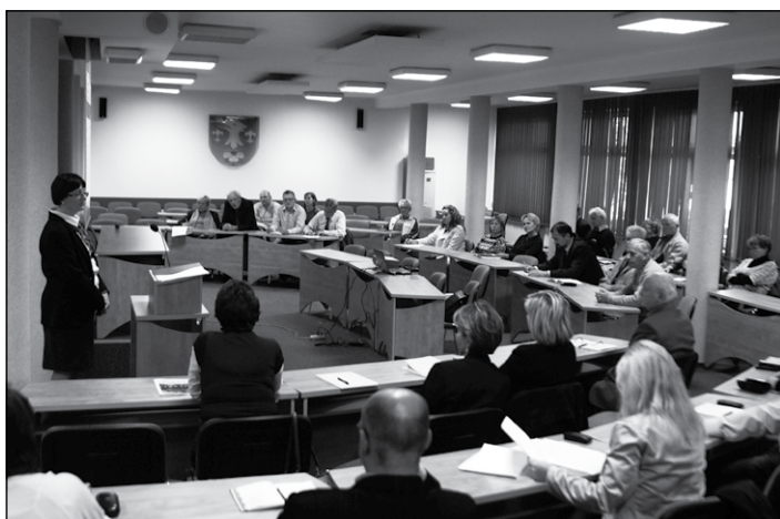
Przedstawiciele organizacji pozarządowych podczas konsultacji

13 października 2011 roku w Powiatowym Centrum Konferencyjnym w Wodzisławiu Śląskim odbyło się spotkanie kierowników jednostek Powiatu i komórek organizacyjnych Starostwa z przedstawicielami organizacji pozarządowych działających na terenie powiatu wodzisławskiego.