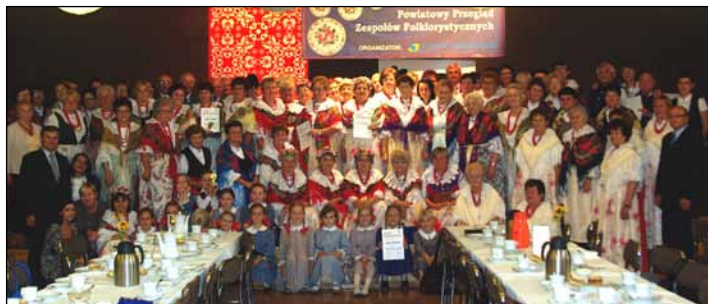
Uczestnicy pierwszego dnia XII Powiatowego Przeglądu Zespołów Folklorystycznych

W Wiejskim Domu Kultury w Czyżowicach w dniach 4-5 października odbył się XII Powiatowy Przegląd Zespołów Folklorystycznych. Łącznie do udziału w tegorocznym przeglądzie zgłosiło się 17 zespołów z terenu powiatu wodzisławskiego.