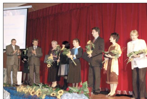
Nagrodzeni Nagrodą Starosty

Powiatowe obchody Dnia Edukacji Narodowej odbyły się 12 października w ZS im. 14 Pułku Powstańców Śląskich w Wodzisławiu Śląskim. W trakcie uroczystości zostały wręczone m.in. Nagrody Starosty Powiatu Wodzisławskiego dla wyróżniających się dyrektorów i nauczycieli powiatowych placówek oświatowych. (str. 2.)