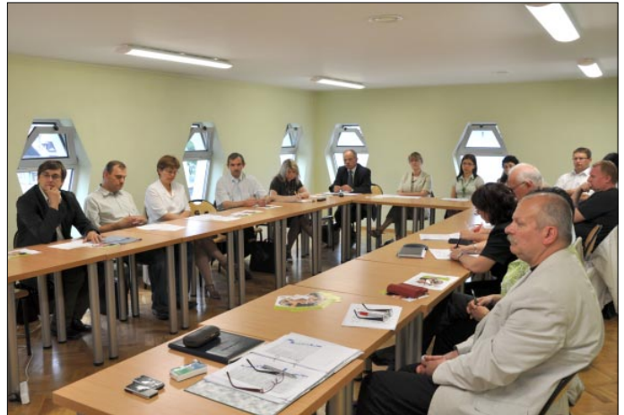
Spotkanie rekrutacyjne w Wodzisławiu Śl.

W realizację zadania zaangażowani są przedstawiciele podmiotów lokalnych występujący w roli konsultantów dla ekspertów opracowujących metodologię, w wyniku czego zostaną przygotowane dokumenty eksperckie, zawierające szczegółowe dane na temat: