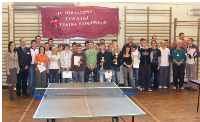
Uczestnicy Turnieju Tenisa Stołowego

Klasyfikacja zawodników znajduje się na stronie www.powiatwodzislawski.pl .