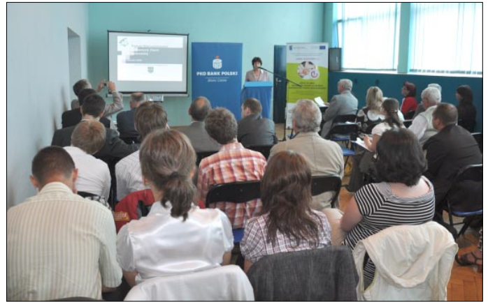
Forum Nieruchomości i Inwestycji Ziemi Wodzisławskiej