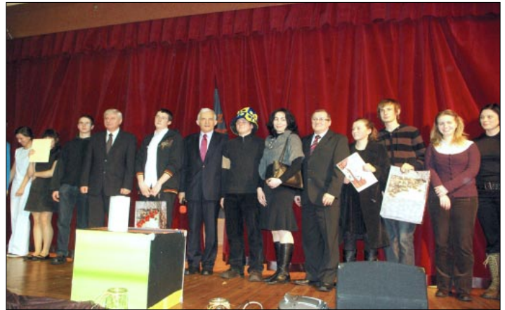
Finał III Powiatowego Festiwalu Teatrów Obcojęzycznych Babel

26 lutego 2009 r. w Zespole Szkół im. 14 Pułku Powstańców Śląskich odbył się Finał III Powiatowego Festiwalu Teatrów Obcojęzycznych Babel 2009. Organizatorem imprezy był Powiatowy Ośrodek Doskonalenia Nauczycieli w Wodzisławiu Śląskim, a wśród zaproszonych gości znaleźli się: Eurodeputowany Jerzy Buzek, Poseł na Sejm Rzeczpospolitej Jerzy Rosół oraz delegacje nauczycieli ze Szwecji i Turcji.