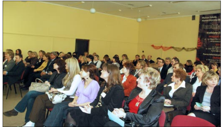
I Wodzislawskie Forum Oświatowe