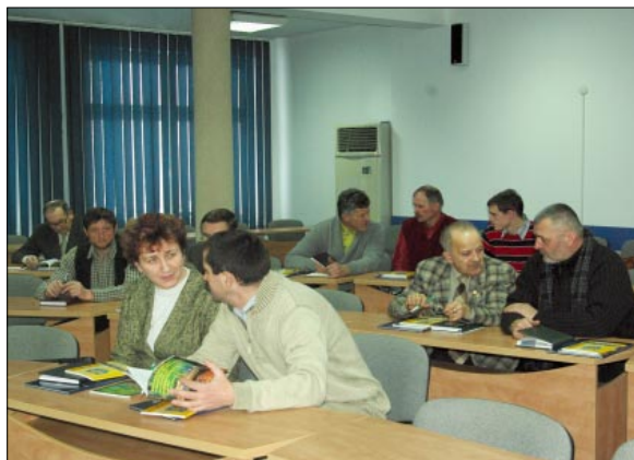
Warsztaty szkoleniowe dla organizacji pozarządowych

18 lutego 2009r. w Powiatowym Centrum Konferencyjnym odbyły się bezpłatne warsztaty szkoleniowe dla organizacji pozarządowych na temat wypełniania ofert i przygotowania odpowiednich załączników w ramach otwartych konkursów ofert na realizację zadań publicznych Powiatu Wodzislawskiego.