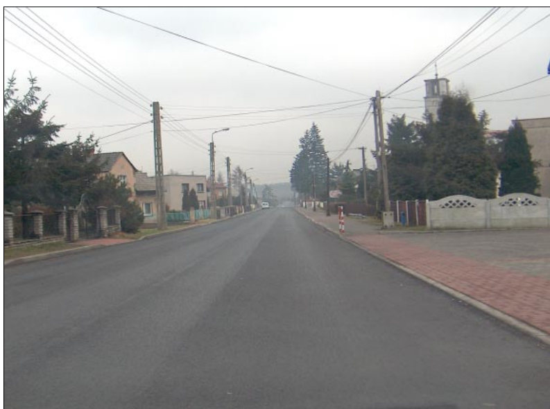
Wyremontowana nawierzchnia i chodniki na ul. Powstańców w Syryni

Powiatowy Zarząd Dróg w Wodzisławiu Śląskim w 2008 roku miał do dyspozycji środki finansowe w wysokości 7 257 616,00 zł, z czego 1 700 000,00 zł w ramach podziału nadwyżki budżetowej. W trakcie roku pozyskano również środki zewnętrzne m.in. dotacje z gmin, środki na usuwanie szkód górniczych, dofinansowanie z FOŚiGW oraz dofinansowanie z programu likwidacji miejsc niebezpiecznych na drogach Gambit 2005.