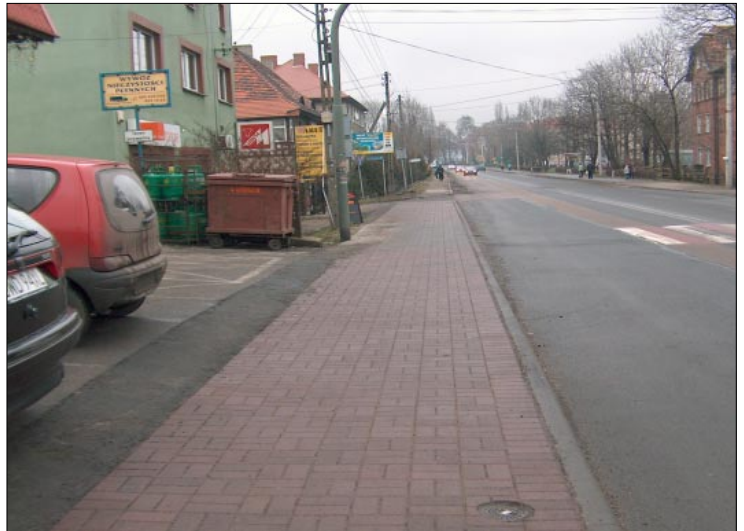
Wyremontowany chodnik wraz z nawierzchnią przy ul. Traugutta w Pszowie

W sezonie 2007/2008 w celu usprawnienia przebiegu akcji zimowego utrzymania dróg teren powiatu został podzielony na kilka rejonów, z konkretnym przypisaniem określonej sieci dróg do poszczególnych jednostek (obecnie do dyspozycji PZD pozostaje sześć piaskarko-solarek, ciągnik rolniczy z rozrzutnikiem oraz ładowarka). Akcja czynna w sezonie 2007/2008 kosztowała około 411 000,00 zł i była prowadzona przez 44 dni. Dla porównania w sezonie 2006/2007 była prowadzona przez 29 dni, a w sezonie 2005/2006 przez 112 dni.