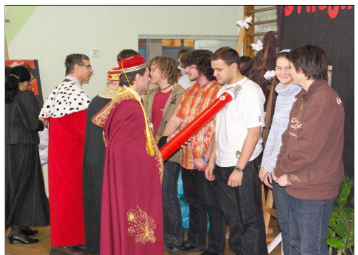
Pasowanie uczniów na krwiodawców