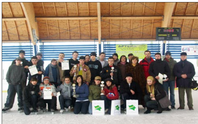
Laureaci Mistrzostw Szkół Ponadgimnazjalnych w Wieloboju Łyżwiarskim

Uczestnicy zawodów rywalizowali w dwóch konkurencjach: tor przeszkód oraz sztafeta. Każdy zespół wykonywał po dwa przejazdy, a o klasyfikacji końcowej decydowała suma wszystkich czasów. Każdy z uczestników mógł liczyć na gorący doping z trybun, na których zasiadły dzieci z pobliskiego przedszkola oraz uczniowie Zespołu Szkół Ponadgimnazjalnych w Pszowie. Wszystkim zespołom wręczono pamiątkowe dyplomy, a najlepsi otrzymali puchary oraz piłki ufundowane przez Starostwo Powiatowe w Wodzisławiu Śląskim. (BKT)