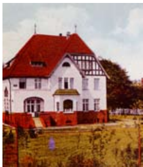
▲ Willa dla lekarza naczelnego sanatorium, stan z ok. 1907 r.

wodną maszyną uruchamiała dwa generatory prądu stałego. Jedna prądnica była w stanie przy 800 obrotach na minutę zasilić 320 żarówek jarzeniowych. Druga, mniejsza, służyła do ładowania zgromadzonych w odrębnym pomieszczeniu 110 akumulatorów w pojemnikach szklanych, które w wypadku awarii urządzeń zapewniały dopływ prądu przez około trzy godziny.