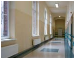
◀ Widok szpitalnego korytarza

Remont szpitala rozpoczął się dopiero na początku obecnego wieku. W 2002 r. podjęto decyzję o wymianie dotychczasowej kotłowni na nową oraz instalacji centralnego ogrzewania. Stare kotły zastąpiono kotłami nowej generacji, oszczędnymi i ekologicznymi. Później wyremontowano kuchnię oraz konstrukcję dachową nad jej pomieszczeniem. W dalszej kolejności wymieniono pokrycie dachowe na budynku pawilonu głównego i wstawiono w nim nowe okna. Uporządkowano również sprawy wodno-ściekowe szpitala, budując nowy wodociąg, pozwalający czerpać wodę z sieci miejskiej, i kolektor, służący odprowadzaniu ścieków do oczyszczalni "Karkoszka". W budynku głównym zaś zamontowano windę osobową, przystosowano sanitariaty do użytku osób niepełnosprawnych oraz zmodernizowano jego wnętrze, by odpowiadało współczesnym wymogom szpitalnym. Przeprowadzane remonty i inwestycje miały na celu polepszenie głównie warunków pobytu chorych w szpitalu, ale równie ważnym też powodem ich podjęcia było ratowanie zabytkowej substancji budynków szpitalnych i przywrócenie im niegdysiejszego splendoru.