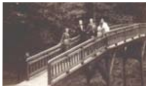
▲ Kładka nad wąwozem w parku

Nowe trendy w sposobie leczenia chorób płuc pociągnęły za sobą stopniowo także przekształcenie dotychczasowego sanatorium przeciwgruźliczego w lecznicę zajmującą się nie tylko gruźlicą płuc, ale i innymi chorobami układu od-