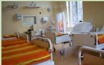
◀ Sala chorych

Remont szpitala rozpoczął się dopiero na początku obecnego wieku. W 2002 r. podjęto decyzję o wymianie dotychczasowej kotłowni na nową oraz instalacji centralnego ogrzewania. Stare kotły zastąpiono kotłami nowej generacji, oszczędnymi i ekologicznymi. Później wyremontowano kuchnię oraz konstrukcję dachową nad jej pomieszczeniem. W dalszej kolejności wymieniono pokrycie dachowe na budynku pawilonu głównego i wstawiono w nim nowe okna. Uporządkowano również sprawy wodno-ściekowe szpitala, budując nowy wodociąg, pozwalający czerpać wodę z sieci miejskiej, i kolektor, służący odprowadzaniu ścieków do oczyszczalni "Karkoszka". W budynku głównym zaś zamontowano windę osobową, przystosowano sanitariaty do użytku osób niepełnosprawnych oraz zmodernizowano jego wnętrze, by odpowiadało współczesnym wymogom szpitalnym. Przeprowadzane remonty i inwestycje miały na celu polepszenie głównie warunków pobytu chorych w szpitalu, ale równie ważnym też powodem ich podjęcia było ratowanie zabytkowej substancji budynków szpitalnych i przywrócenie im niegdysiejszego splendoru.