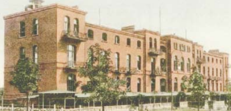
▲ Pierwotny wygląd pawilonu głównego od strony południowej