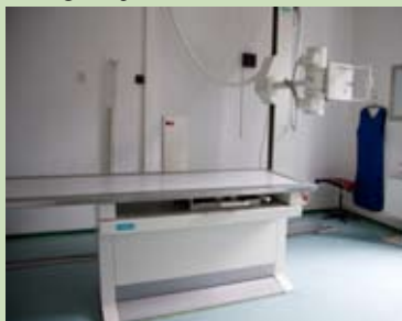
◀ Fragment pracowni RTG

Szpital zajmuje się diagnostyką i leczeniem chorych z problemami układu oddechowego, tj. gruźlicy, nowotworów płuc, przewlekłego schorzenia oskrzeli.