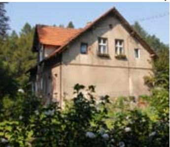
▼ Dom mieszkalny

B udynek kotłowni, usytuowany na północ od budynku gospodarczego, jest obiektem parterowym, wymurowanym z cegły na rzucie zbliżonym do kwadratu, nakrytym dachem wielospadowym. Środkowe partie ścian w elewacji północnej i południowej zwieńczone są szczytami. Formę dekoracyjną stanowią prostokątne blendy w elewacji północnej, zaś w elewacji wschodniej i południowej płaskie pilastry dzielące ściany na kilka pól, w których płaszczyzną wpisane są otwory okienne i drzwiowe, przesklepione łukami.