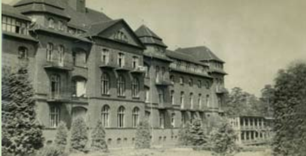
▲ Pawilon główny sanatorium z lat 30. XX w. z widoczną z prawej strony murowaną leżalnią piętrową