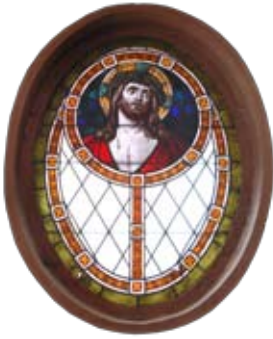
◆ Okno witrażowe w ścianie dawnej kaplicy sanatoryjnej

one również w strukturze organizacyjnej placówki. Dotychczasowego właściciela i zarządcę zastąpiła w 1922 r. Spółka Bracka z siedzibą w Tarnowskich Górach. Zmieniła się więc i jej nazwa na Lecznica Przeciwgruźlicza Spółki Brackiej.