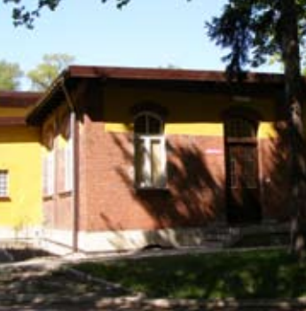
▲ Budynek gospodarczo-administracyjny

B udynek gospodarczo-administracyjny, stojący z północnej strony pawilonu głównego, jest obiektem parterowym, wymurowanym z cegieł i nieotynkowanym z zewnątrz poza niewielkimi fragmentami w górnych partiach ścian. Bryła budynku składa się z kilku połączonych z sobą segmentów, okalających wewnętrzny dziedziniec – patio. Całość nakryta jest wielospadowym dachem. Główne wejście do budynku znajduje się w jego południowej części. Wewnątrz budynku istnieje szereg pomieszczeń o różnorodnym przeznaczeniu i funkcji, spośród których najważniejsze to: pralnia, kuchnia, jadalnia i biura administracji. Otwory okienne zamknięte są, podobnie jak i otwory drzwiowe, ceglanyimi łukami konstrukcyjnymi.