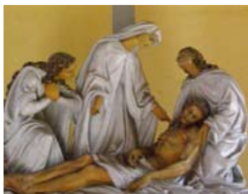
Zdjęcie z krzyża