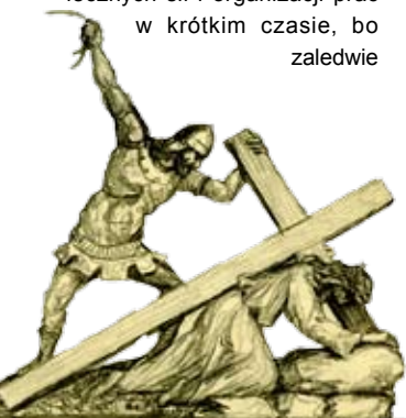
Projekt rzeźby do stacji VII Ludwika Konarzewskiego

Przy takiej mobilizacji społecznych sił i organizacji prac w krótkim czasie, bo zaledwie