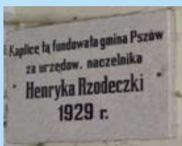
Tablica fundacyjna kaplicy

Kaplica na rzucie oktagonu, z prostokątnym przedsionkiem, opięta oskarpowanymi narożami. Nakryta dachem wielospadowym, kopulastym, przedsionek natomiast dachem walcowatym; całość obita blachą. Przedsionek poprzedzony jednobiegowymi schodami, rozszerzającymi się ku dołowi. We wszystkich elewacjach nisze o półkolistym wykroju i różnicowanych wymiarach. Wejście zamknięte łukiem w postaci profilowanej archiwolty, wspartej na szerokich pilastrach.