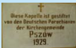
Tablica fundacyjna kaplicy

Kaplica na planie prostokąta z dachem trójspadowym. Otwór drzwiowy prostokątny, głęboko osadzony. Ponad nim tej samej szerokości półkolista nisza z otworem w formie nadświetla. Fasadę zamyka szczyt z tympanonem oraz łagodnymi splotami ze spiralnie zwiniętymi wolutami, których dolne krawędzie opierają się na wspornikach uskokowo schodzących do linii narożnika. Tympanon podkreślony gierowanym gzymsem.