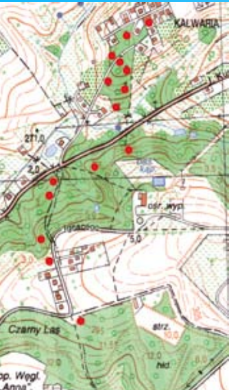
Fragment mapy Pszowa z uwzględnieniem Kalwarii

W odległości około 3 km od centrum Pszowa w stronę Rydułtów położona jest Kalwaria Pszowska. Obejmuje ona rozległy, zadrzewiony obszar, na którym rozlokowanych jest czternaście murowanych kaplic, poświęconych stacjom Drogi Krzyżowej Jezusa Chrystusa. Każda kaplica posiada własną, niepowtarzalną architekturę. W ich wnętrzach znajdują się ołtarze wraz z grupami figuralnymi, przedstawiającymi sceny z męki Chrystusa w drodze na Golgotę. Stację XII stanowią trzy wysokie, drewniane krzyże. Kaplica ostatniej stacji uzyskała status świątyni parafii pw. Zmartwychwstania Pańskiego.