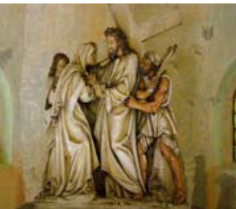
Pożegnanie z Matką