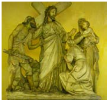
Placzące nad Jezusem niewiasty