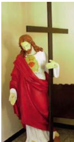
Figura Chrystusa z krzyżem z dawnego ołtarza „wielkiej kaplicy”

Po II wojnie światowej zainteresowanie Kalwarią ze strony przybywających do Pszowa pielgrzymów stopniowo malało. Nie był to okres sprzyjający manifestowaniu uczuć religijnych i odwiedzeniu związanych z nimi miejsc. Ale właśnie wtedy, wikary w Rydułtowach w latach 1953–1954 – ks. Franciszek Blachnicki, często zabierał ministrantów i dzieci z parafii na wycieczkę na Kalwarię Pszowską. Zapewne tu zrodziła się idea jego pierwszych “Oaz Dzieci Bożych” i w ogóle ruchu